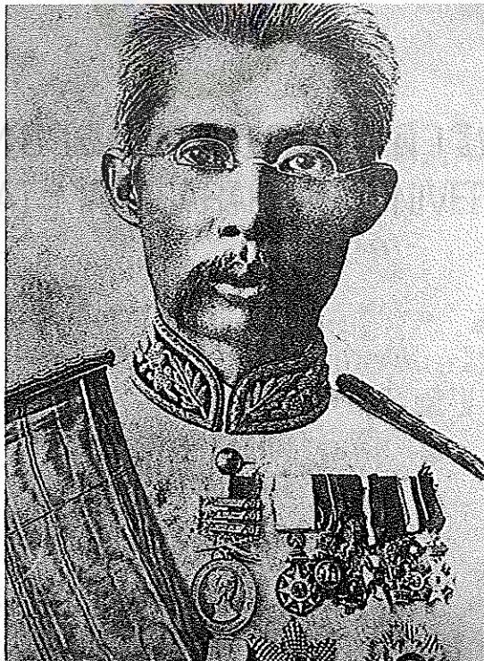
ภาพที่ 4.4 พระเจ้าบรมวงศ์เธอ กรมหลวงพิชิตปรีชากร ที่มา (มูลนิธิสารานุกรมวัฒนธรรมไทย. 2542 เล่ม 3, หน้า 994)