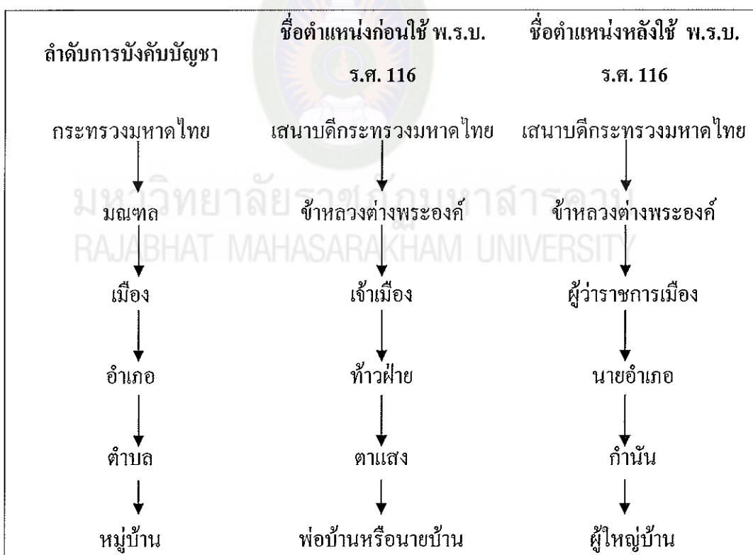
แผนภูมิที่ 4.1 แสดงการบริหารการปกครองหลังประกาศใช้พระราชบัญญัติปกครองท้องที่ ร.ศ. 116

ได้มีการจัดลำดับการบังคับบัญชาและมีการเปลี่ยนชื่อตำแหน่งในการบริหารราชการหลังจาก ได้มีพระราชบัญญัติลักษณะการปกครองท้องที่รัตนโกสินทร์ศก 116 ดังแสดงในแผนภูมิที่ 4.1