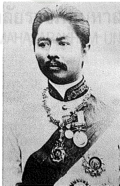
ภาพที่ 4.2 พระเจ้าบรมวงศ์เธอ กรมหลวงประจักษ์ศิลปาคม ข้าหลวงต่างพระองค์สำเร็จราชการหัวเมืองลาวพวน ที่มา (นายหนวย. 2531, หน้า 82)

ก่อนที่สมเด็จพระเจ้าน้องยาเธอ กรมหลวงดำรงราชานุภาพเสนาบดีกระทรวงมหาดไทยจะได้ทรงจัดระบบการปกครองส่วนภูมิภาคให้เป็นแบบเทศาภิบาลทั่วพระราชอาณาจักรใน พ.ศ. 2435 นั้น พระบาทสมเด็จพระจุลจอมเกล้าเจ้าอยู่หัวได้ทรงจัดแบ่งกลุ่มหัวเมืองขึ้นนอกออกเป็นมณฑลอยู่แล้ว 6 มณฑล พร้อมทั้งทรงพระกรุณาโปรดเกล้าฯ ให้ข้าหลวงใหญ่ต่างพระองค์ออกไปบัญชาการปกครองประจำมณฑล มณฑลที่ได้จัดตั้งขึ้นก่อน พ.ศ. 2435 ในส่วนของภาคอีสาน ได้แก่