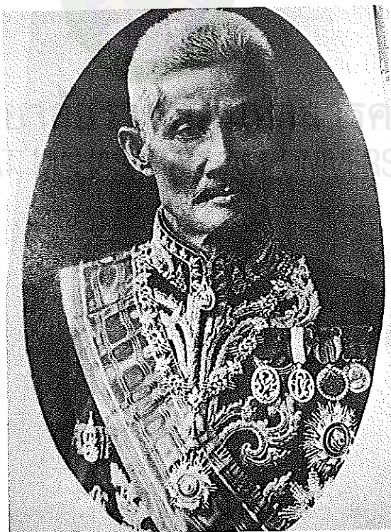
ภาพที่ 4.3 พระเจ้าน้องยาเธอ กรมหลวงสรรพสิทธิประสงค์ ข้าหลวงใหญ่หัวเมืองลาวทวิมา (กรมศิลปากร. 2532, หน้า 36)

1. มณฑลลาวพวน เปลี่ยนมาจากหัวเมืองลาวฝ่ายเหนือ เหตุที่เรียกว่ามณฑลลาวพวนเพราะเมื่อก่อน ปีพ.ศ. 2436 ได้รวมหัวเมืองทางฝั่งซ้ายแม่น้ำโขงหลายเมืองเข้าเป็นมณฑลเดียวกันกับหัวเมืองทางฝั่งขวา แล้วส่งข้าราชการไปเป็นข้าหลวงรักษาราชการอยู่เฉพาะที่เมืองเชียงขวาง ซึ่งเป็นเมืองใหญ่ในแคว้นพวน อันเป็นนามที่มาแห่งมณฑลนี้ และเรียกกันเป็นสามัญในสมัยนั้น ประกอบกับพลเมืองในแถบหัวเมืองลาวฝ่ายเหนือก็มีสายสัมพันธ์มาจากชาวเมืองพวน และมีชาวเมืองพวนที่เข้าอยู่ทางฝั่งขวาแม่น้ำโขงด้วยเป็นจำนวนมาก ตั้งแต่ในรัชสมัยพระบาท สมเด็จพระนั่งเกล้าเจ้าอยู่หัว หลังเหตุการณ์ ร.ศ. 112 ดินแดนฝั่งซ้ายแม่น้ำโขงตกไปอยู่ในปกครองของฝรั่งเศส หัวเมืองที่ตั้งกัมณฑลลาวพวนทางฝั่งซ้ายแม่น้ำโขงก็ตกเป็นของฝรั่งเศสด้วย ฉะนั้นเมืองใหญ่ของมณฑลนี้ที่ยังเหลืออยู่ในดินแดนฝั่งขวาแม่น้ำโขง จึงเหลืออยู่เพียง 6 เมือง คือ อุดรธานี ขอนแก่น นครพนม สกลนคร หนองคาย และเลย ตั้งกองบัญชาการมณฑลที่บ้านเดื่อหมากแข้ง หรือเมืองอุดรธานี สมเด็จพระเจ้าน้องยาเธอกรมหมื่นประจักษ์ศิลปาคม ทรงดำรงตำแหน่งข้าหลวงใหญ่