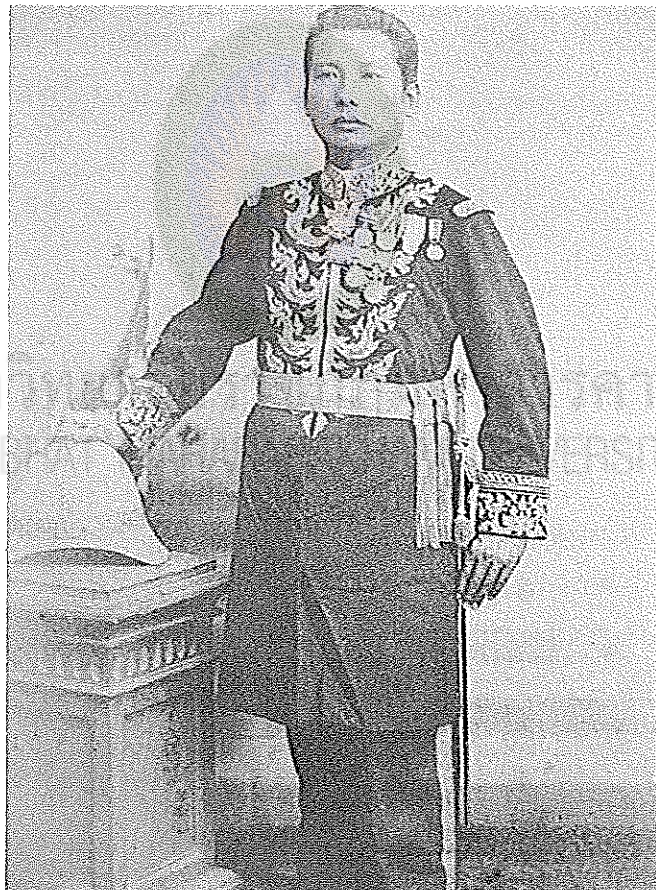
ภาพที่ 4.1 พระยากำแหงสงคราม ที่มา (สุรจิตต์ จันทรสาขา. 2543, หน้า 143)

การปรับปรุงการบริหารราชการหัวเมืองต่าง ๆ ในภาคอีสานและหัวเมืองบริเวณลุ่มน้ำโขงนั้น ได้ดำเนินการดังนี้ พ.ศ. 2433 พระบาทสมเด็จพระจุลจอมเกล้าเจ้าอยู่หัวโปรดให้รวมหัวเมืองลาวเข้าด้วยกัน และจัดการปกครองเป็น 4 กอง 29 คือ หัวเมืองลาวฝ่ายตะวันออก หัวเมืองลาวฝ่ายตะวันออกเฉียงเหนือ หัวเมืองลาวฝ่ายกลาง หัวเมืองลาวฝ่ายเหนือ และมีข้าหลวงกำกับอยู่ที่นครจำปาศักดิ์อีก 1 คน เพื่อควบคุมการปกครองทั้ง 4 กองอีกชั้นหนึ่ง