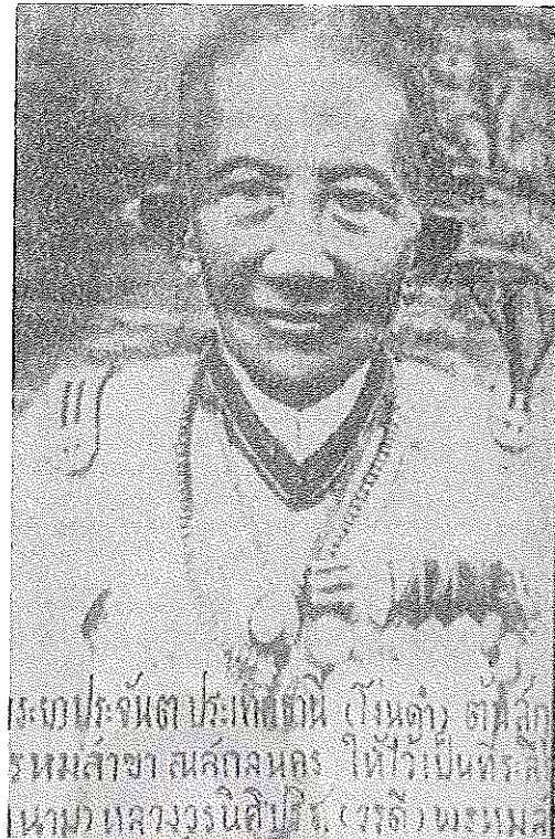
ภาพที่ 2.5 พระยาประจันตประเทษธานี (โง่นคำ พรหมสาขา ณ สกลนคร)

ทิมา (คณะกรรมการอำนวยการจัดงานเฉลิมพระเกียรติพระบาทสมเด็จพระเจ้าอยู่หัวฯ, 2543, หน้า 218)