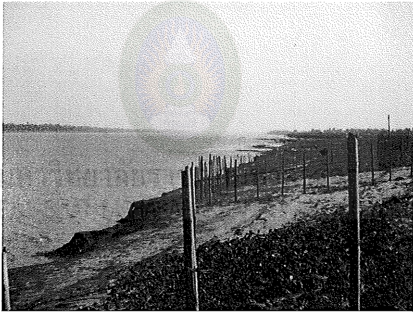
ภาพที่ 2.1 เตรียมดินเพื่อปลูกยาสูบบริเวณหาดริมแม่น้ำโขง ที่อำเภอบ้านแพง จังหวัดนครพนม (ถ่ายภาพเมื่อวันที่ 16 พฤศจิกายน พ.ศ. 2523)