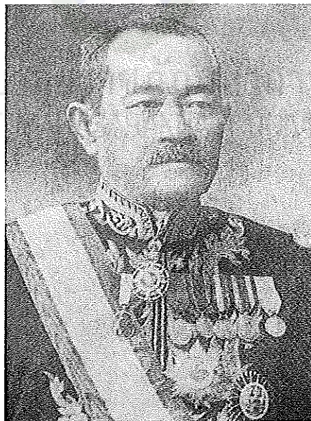
ภาพที่ 2.3 พันเอกมหาอำมาตย์ตรี พระวรวงศ์เธอพระองค์เจ้าวิวัฒนา ข้าหลวงต่างพระองค์ สำเร็จราชการมณฑลลาวพวน (พ.ศ. 2442 – 2449)

ส่วนราษฎรบริเวณจากหมากแข้ง อุดรธานี ถึงบริเวณลำน้ำเหืองนั้น พระวรวงศ์เธอพระองค์เจ้าวิวัฒนา ข้าหลวงเทศาภิบาลสำเร็จราชการมณฑลอุดรได้มีใบบอก การตรวจราชการ ลงวันที่ 26 พฤษภาคม พ.ศ. 2447 เพื่อขึ้นกราบทูลพระเจ้าอยู่หัว กรมขุนสมมตอมรพันธุ์ ราชเลขานุการ ถึงลักษณะพื้นที่และการทำมาหากินของราษฎรว่า มีแต่การทำนา ทำไร่ เนื้อที่นาตามบ้านเหล่านี้มีน้อย มักเป็นป่าดงเสียมมาก ประกอบอาชีพ ทำไร่มากกว่าทำนา เพราะเป็นอยู่ใกล้เขาใกล้ดง 12