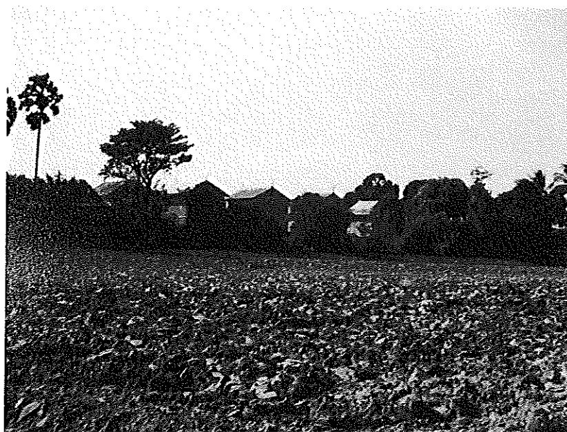
ภาพที่ 2.2 โรงบ่มไบยาสูบ อำเภอบ้านแพ่ง จังหวัดนครพนม (ถ่ายภาพเมื่อวันที่ 16 พฤศจิกายน พ.ศ. 2523)

ส่วนดินแดนฝั่งซ้ายแม่น้ำโขงของฝรั่งเศสเป็นที่ป่าดงหนาบ้างบางบ้าง ที่ราบมีน้อย และที่ห่างฝั่งไปก็เป็นภูเขา โขดเนินมาก ทางทิศตะวันออกของท่าแขกมีที่นาตลอดจนเกือบถึงเชิงเขาภูฮัก กิโลเมตร 87 ที่นาเหล่านี้อยู่หลังท่าแขกตอนหนึ่งกับที่บ้านมหาไชย กม. 45 ห่อมใหญ่ห่อมหนึ่งกับบ้านยมราช กม. 66 อีกห่อมใหญ่ห่อมหนึ่ง และพันภูฮักไปแล้ว มีที่นาซึ่งอยู่ในกระทะมีเขารอบ คล้ายคลึงกันกับตอนเชิงคำหรือคำปาง ส่วนแต่เป็นที่มิประโยชน์ในการเพาะปลูก เช่น เมืองคำเกิด และนากาย เป็นต้น อีกหลายแห่งจนกระทั่งเข้าป่าสูงข้ามช่องแก้วเหนือไปเข้าประเทศญวน 9