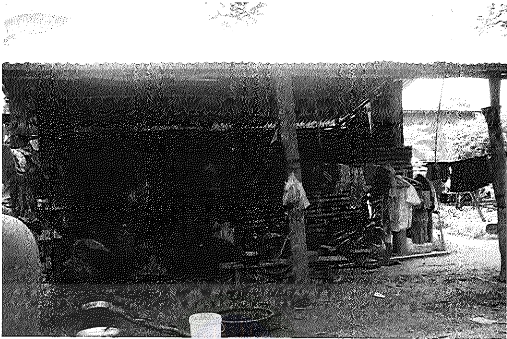
สภาพที่อยู่อาศัย