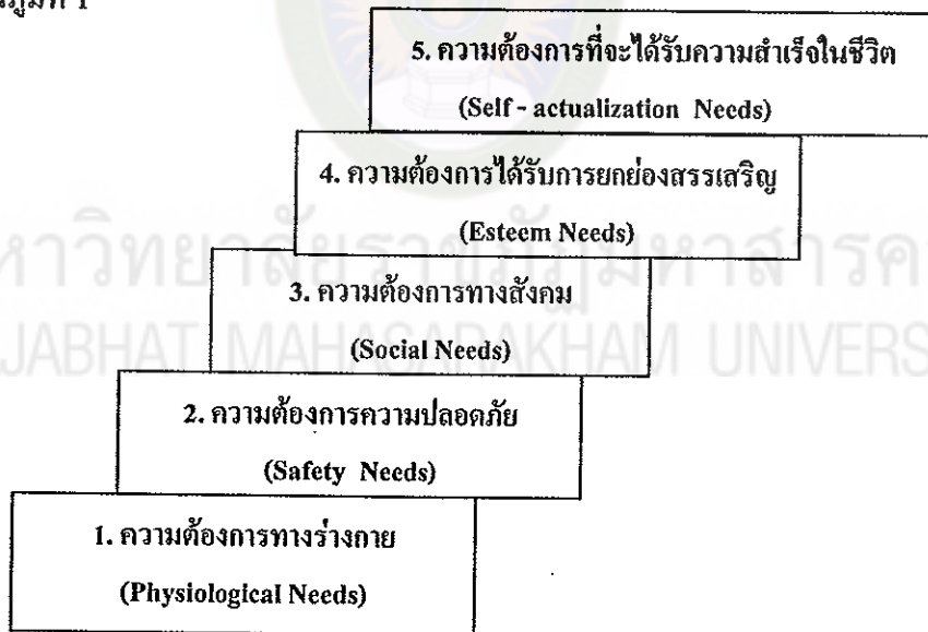
แผนภูมิที่ 1 ลำดับขั้นความต้องการของมนุษย์

ขั้นที่ 5 ความต้องการที่จะได้รับความสำเร็จในชีวิต (Self-Actualization Needs) เมื่อความต้องการพื้นฐานขั้นที่ 1 ถึงขั้นที่ 4 ได้รับการตอบสนองแล้ว ในขั้นนี้เป็น ความต้องการขั้นสูงสุดของมนุษย์ คืออยากให้เกิดความสำเร็จในทุกสิ่งทุกอย่างตามความต้องการของตน ดังแผนภูมิที่ 1