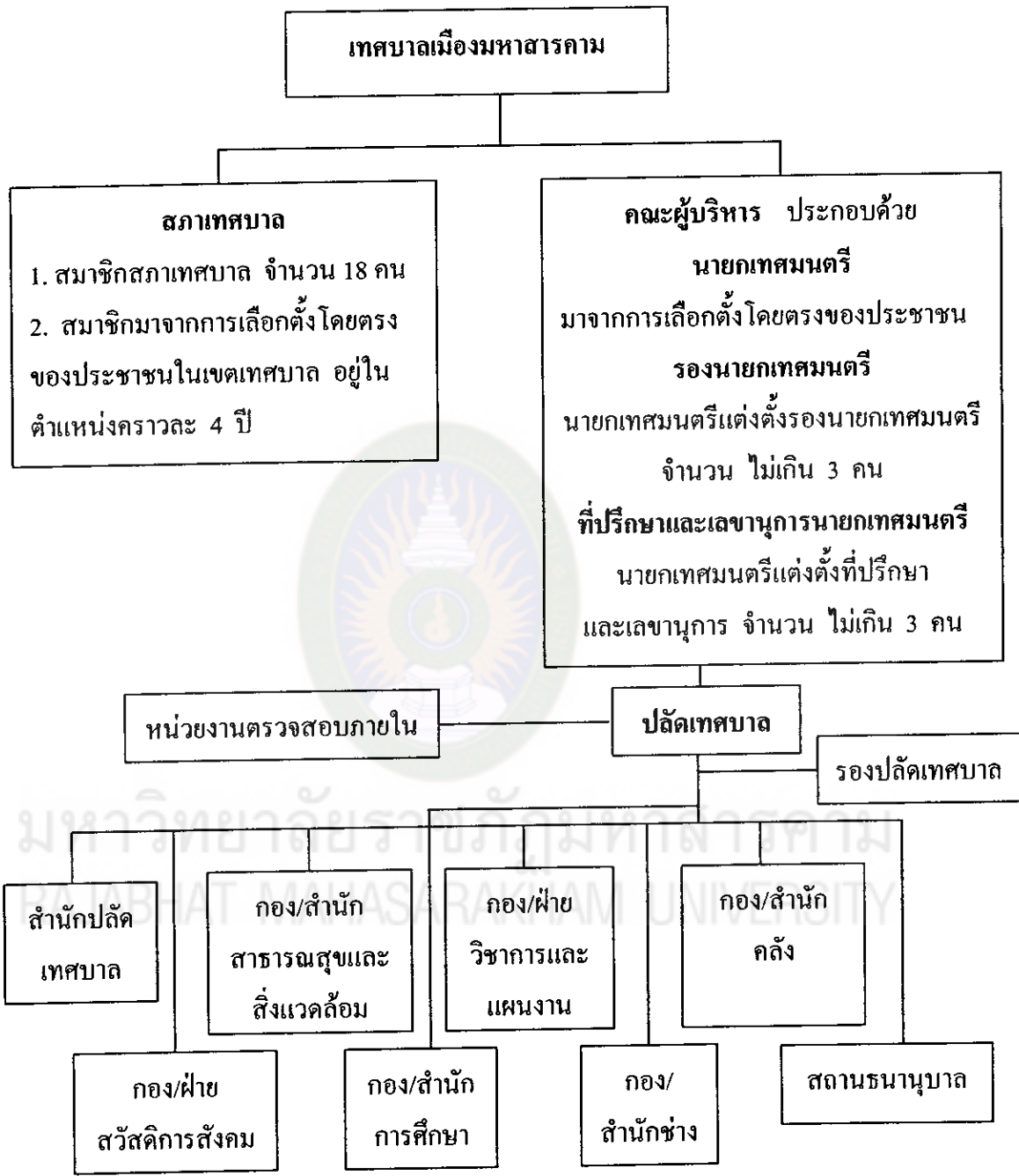
แผนภูมิที่ 1 โครงสร้างของเทศบาลเมืองมหาสารคาม (เทศบาลเมืองมหาสารคาม, 2549 : 15)