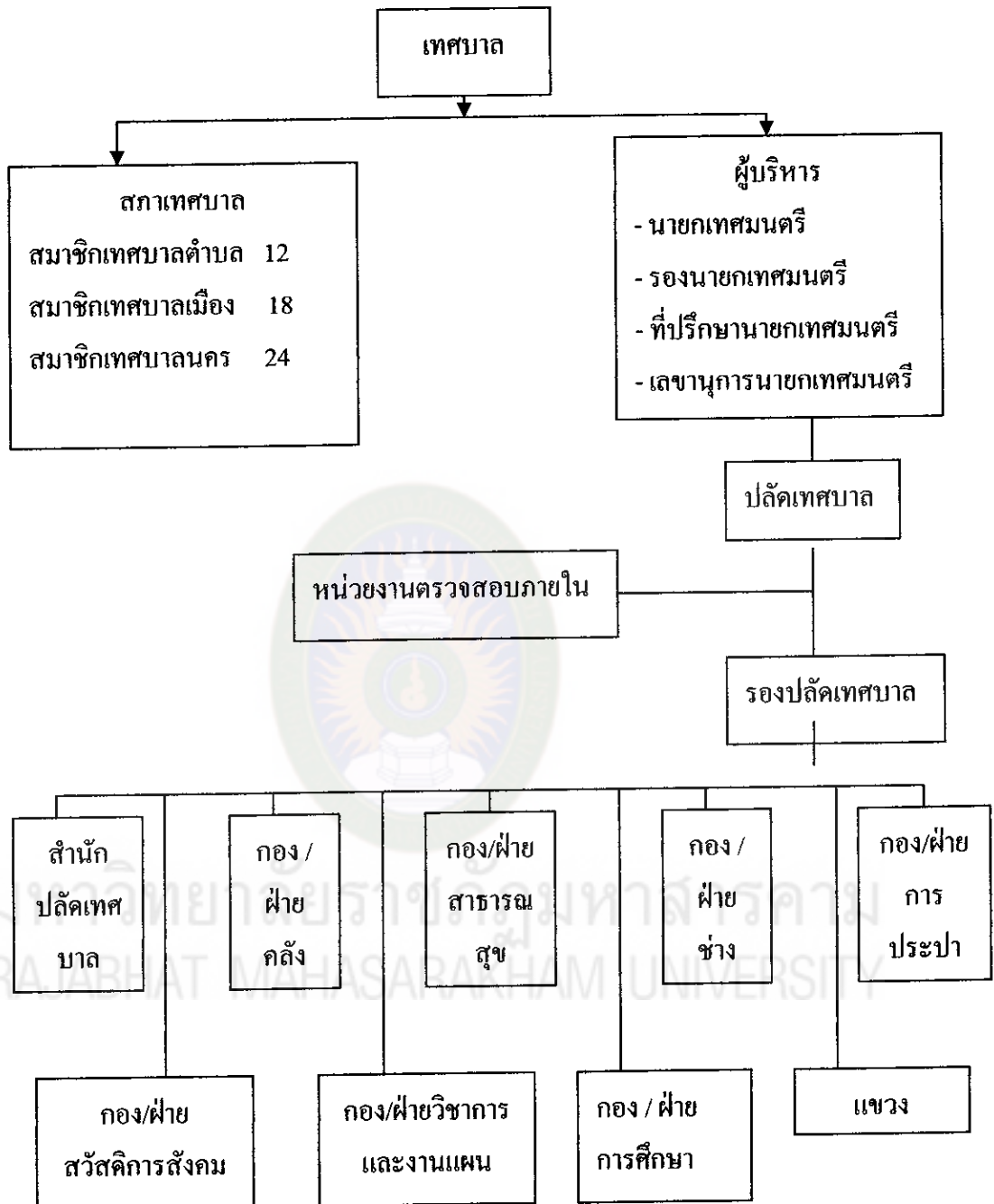
แผนภูมิที่ 1 แสดงโครงสร้างและการแบ่งส่วนการบริหารของเทศบาล