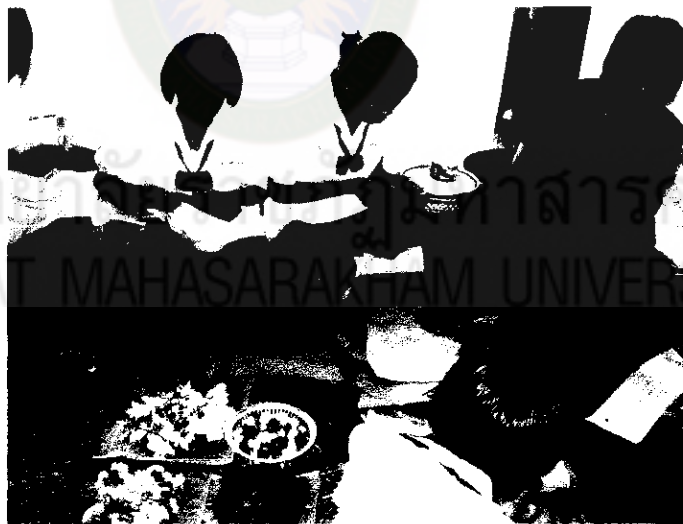
ภาพที่ 13 การร่วมทำบายศรีของภูมิปัญญาท้องถิ่น