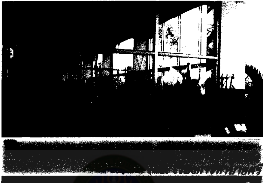
ภาพที่ 20 การจัดแสดงนิทรรศการผลงานนักเรียน 1