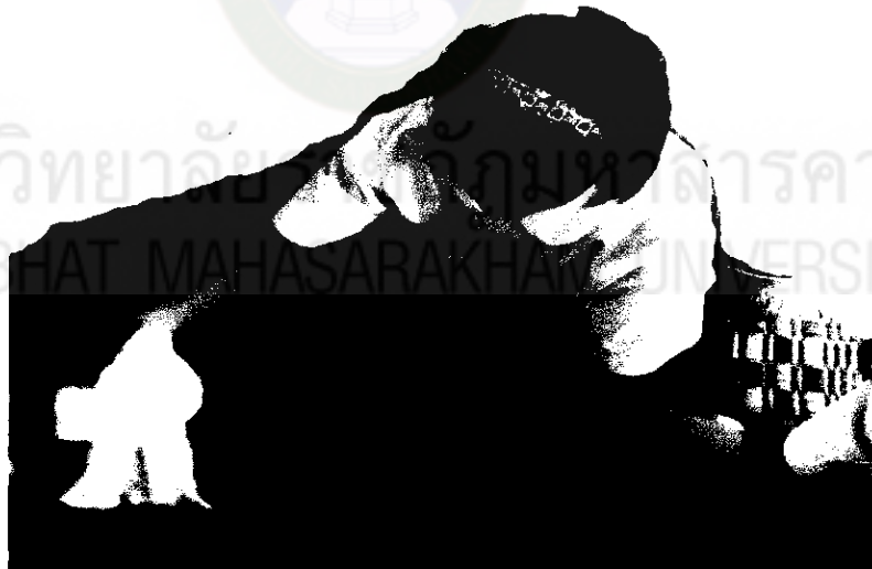
ภาพที่ 11 เลือกและทำความสะอาดใบตอง