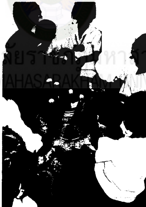
ภาพที่ 17 การประดับตกแต่งบายศรี