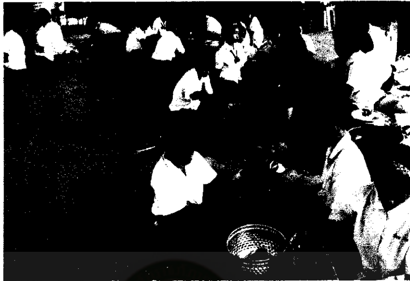
ภาพที่ 12 การทำงานเป็นกลุ่มของนักเรียน