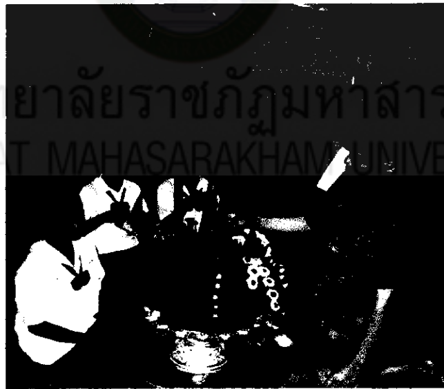
ภาพที่ 15 การร่วมทำบายศรีของภูมิปัญญาท้องถิ่น