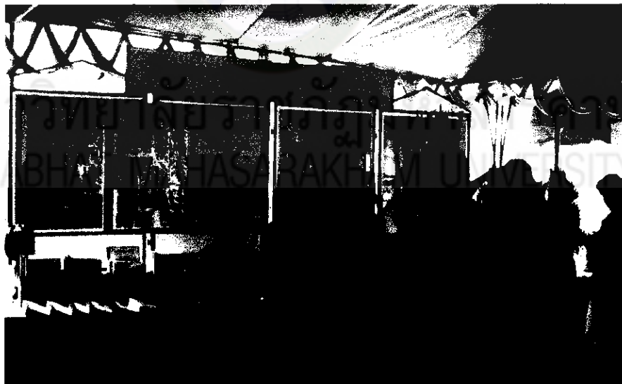
ภาพที่ 19 การจัดแสดงนิทรรศการผลงานนักเรียน