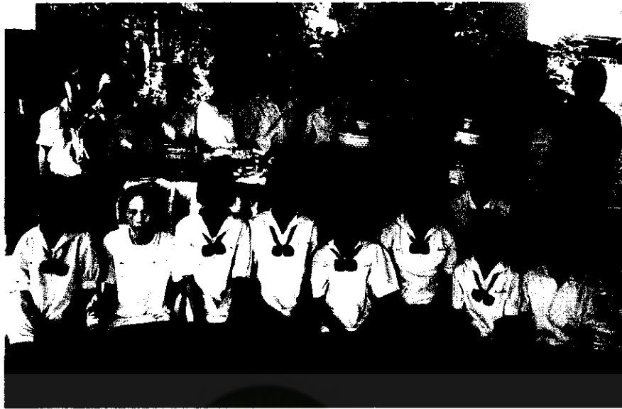
ภาพที่ 18 ครู นักเรียน และภูมิปัญญาท้องถิ่น ร่วมถ่ายภาพกับผลงานการทำบายศรี