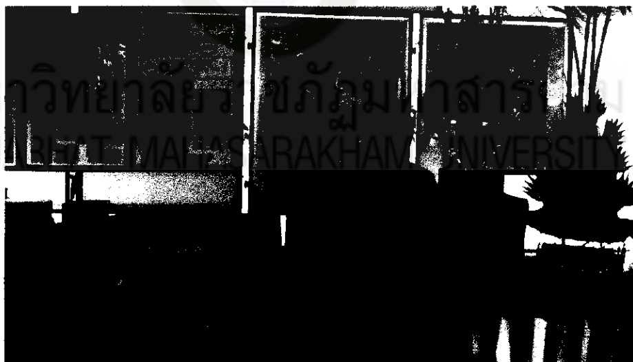
ภาพที่ 21 การจัดแสดงนิทรรศการผลงานนักเรียน 2