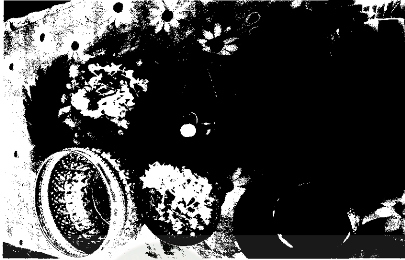
ภาพที่ 10 เตรียมวัสดุในการทำบายศรี