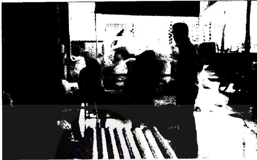
ภาพภาคผนวกที่ 1 สัมภาษณ์เจ้าของธุรกิจค้าผ้าประเภท โรงงานอุตสาหกรรมและลูกจ้าง