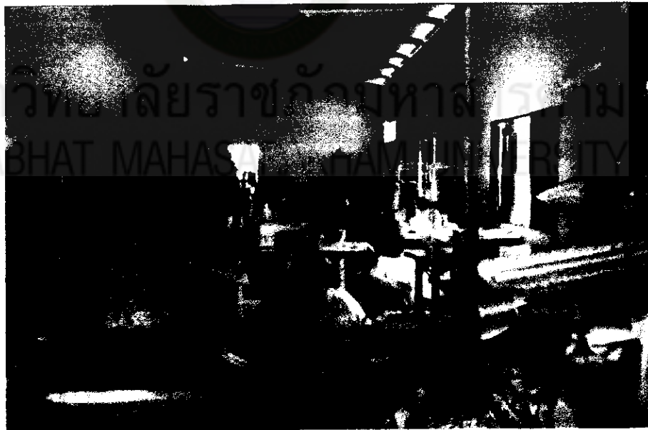
ภาพภาคผนวกที่ 2 เยี่ยมชมโรงงานอุตสาหกรรม