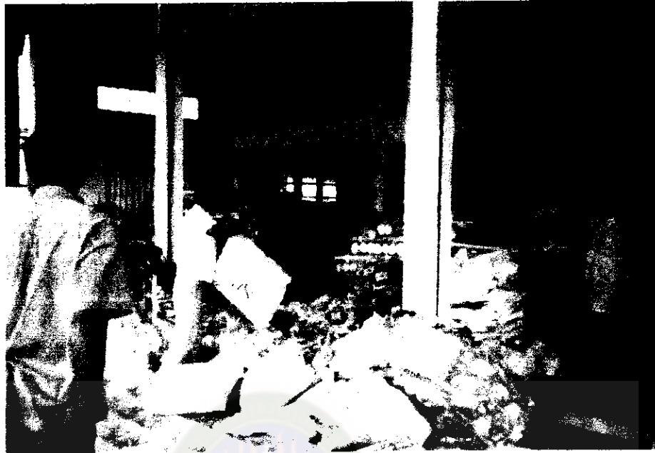
ภาพภาคผนวกที่ 5 เสริมเรียบร้อย และเตรียมจำหน่าย