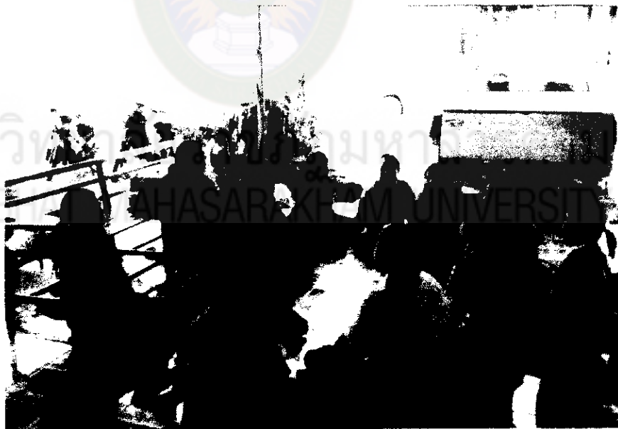
ภาพภาคผนวกที่ 6 จัดกลุ่มเสาวนาเจ้าของธุรกิจค้าผ้าประเภทธุรกิจในครัวเรือน