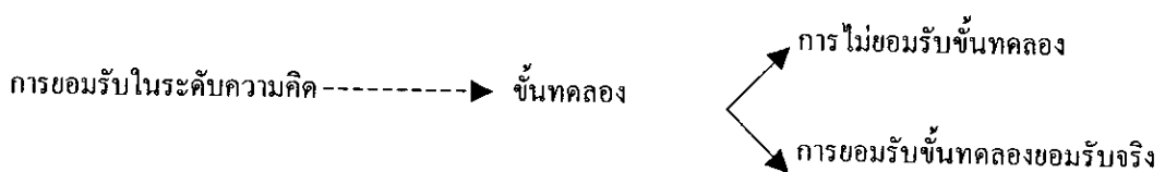
แผนภูมิที่ 1 กระบวนการยอมรับ

เบลล์ และโบเลนค์ (Beal and Bohlen. 1957 ; อ้างถึงใน จิระวัฒน์ วงศ์สวัสดิวัฒน์, 2529 : 19) ได้พูดถึงกระบวนการยอมรับว่า เป็นขั้นทดลองในระดับความคิด (Mental Trial) นั่นคือ วิทยาการแผนใหม่ได้ถูกนำมาประเมินเข้ากับสถานการณ์ในลักษณะของนามธรรม ซึ่งผลของการประเมินอาจทำให้เกิดการยอมรับหรือไม่ยอมรับในระดับความคิด การยอมรับในขั้นนี้จะมีอิทธิพลโดยตรงต่อการยอมรับในภาคปฏิบัติ และการใช้ต่อเนื่องในเวลาต่อมา หรืออาจหยุดอยู่เพียงเท่านั้นก็เป็นได้ บ่อยครั้งที่พบว่าวิทยาการแผนใหม่หลายอย่างเป็นที่ยอมรับใน