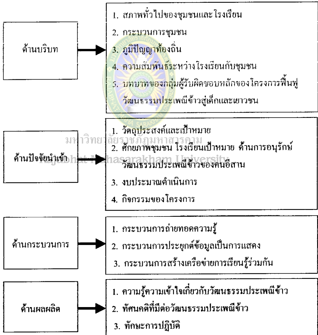
แผนภูมิที่ 3 กรอบแนวคิดเกี่ยวกับการวิจัยรูปแบบซีพีไอโมเดล (CIPP model)

ผู้วิจัยได้สรุปเป็นกรอบแนวคิดผังแผนภูมิ ดังนี้