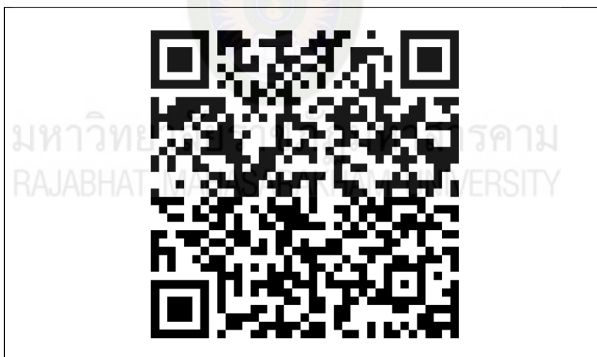
ภาพที่ ก.2 แสดงหนังสืออิเล็กทรอนิกส์ ขออนุญาตให้ผู้วิจัยใช้สถานที่ทดลองเก็บรวบรวมข้อมูล (Try out)