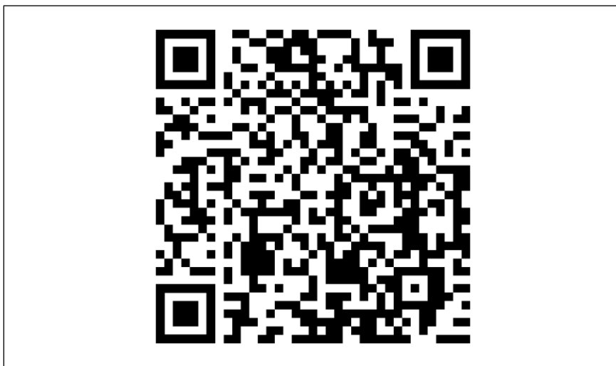
ภาพที่ ก.1 แสดงหนังสืออิเล็กทรอนิกส์ ขอเชิญเป็นผู้เชี่ยวชาญตรวจสอบเครื่องมือการวิจัย