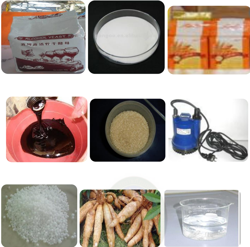
ภาพที่ ก-1 ยีสต์แอลกอฮอล์ ปริ๊มิกซ์ ยีสต์ขนมปัง กากน้ำตาล น้ำตาลทรายแดง ปั้มน้ำไดโว ปู่ยูเรียหัวมันสำปะหลังหมักสด น้ำสะอาด เครื่องบดมัน