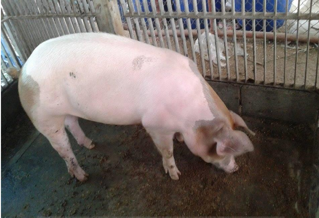
ภาพที่ ก-7 สุกรช่วงท้ายของการทดลอง