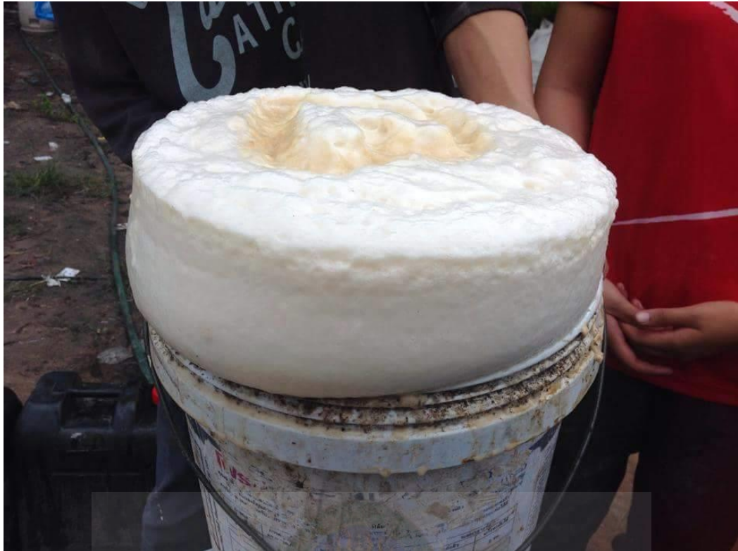
ภาพที่ ก-5 การบูมของเชื้อยีสต์หลังทิ้งไว้ 10 นาที

มหาวิทยาลัยราชภัฏมหาสารคาม RAJABHAT MAHASARAKHAM UNIVERSITY