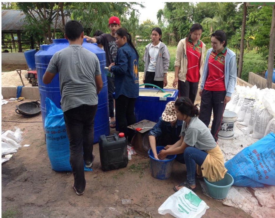
ภาพที่ ก-2 การละลายน้ำตาลทรายและยีสต์เพื่อเตรียมหัวเชื้อ

มหาวิทยาลัยราชภัฏมหาสารคาม RAJABHAT MAHASARAKHAM UNIVERSITY