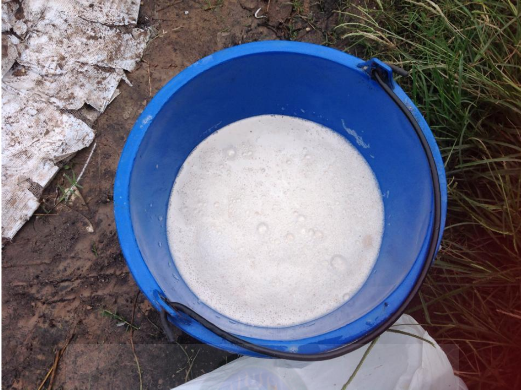
ภาพที่ ก-4 การขยี้ยีสต์เพื่อให้เกิดการตื่นตัวของยีสต์

มหาวิทยาลัยราชภัฏมหาสารคาม RAJABHAT MAHASARAKHAM UNIVERSITY