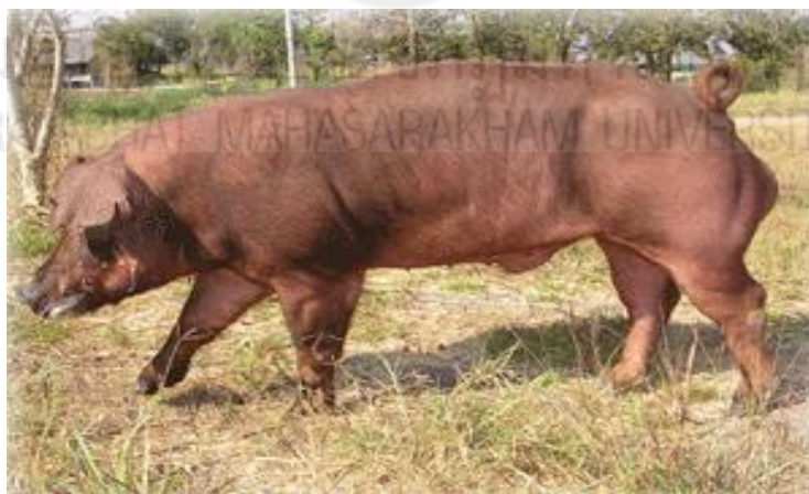
ภาพที่ 2.3 สุกรพันธุ์ดอร์คเจอร์ซี

มีถิ่นกำเนิดจากประเทศอเมริกา มีสีแดง หูปรกเป็นส่วนใหญ่ ลำตัวสั้นกว่าลาร์จไวท์และแลนด์เรซ มีลำตัวหนา หลังโค้ง โตเต็มที่ 200-250 กิโลกรัมเป็นสุกรที่ให้ลูกไม่ดกเฉลี่ย 8-9 ตัว เลี้ยงลูกไม่เก่ง หย่านมเฉลี่ย 6-7 ตัว ลูกสุกรหลังจากอายุ 2 เดือนไปแล้วเจริญเติบโตเร็วมีความแข็งแรงทนทานต่อสภาพดินฟ้าอากาศทุกชนิดนิยมใช้เป็นสายพ่อพันธุ์เพื่อผลิตลูกผสมที่สวยงาม แผ่นหลังกว้างเจริญเติบโตเร็ว ดังแสดงในภาพที่ 3