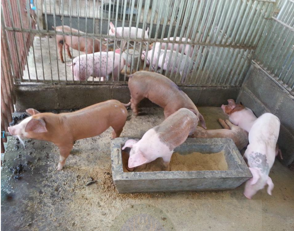
ภาพที่ ก-6 สุกรก่อนเข้างานวิจัย