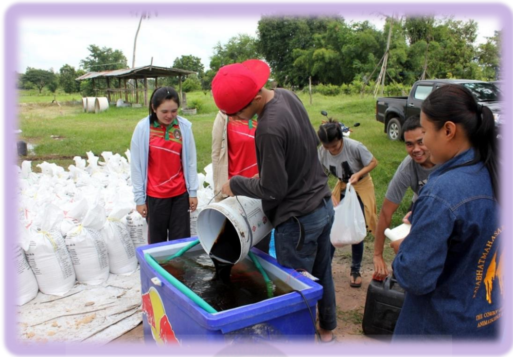
ภาพที่ ก-3 การเตรียมสารละลายกากน้ำตาล + ยูเรีย