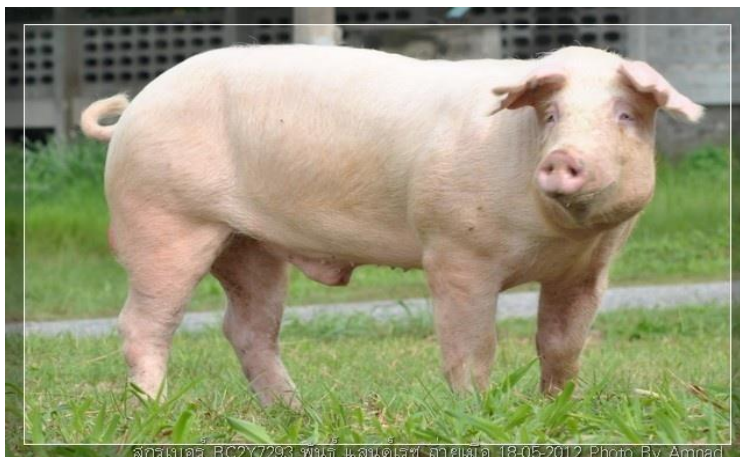
ภาพที่ 2.2 สุกรพันธุ์แลนด์เรซ