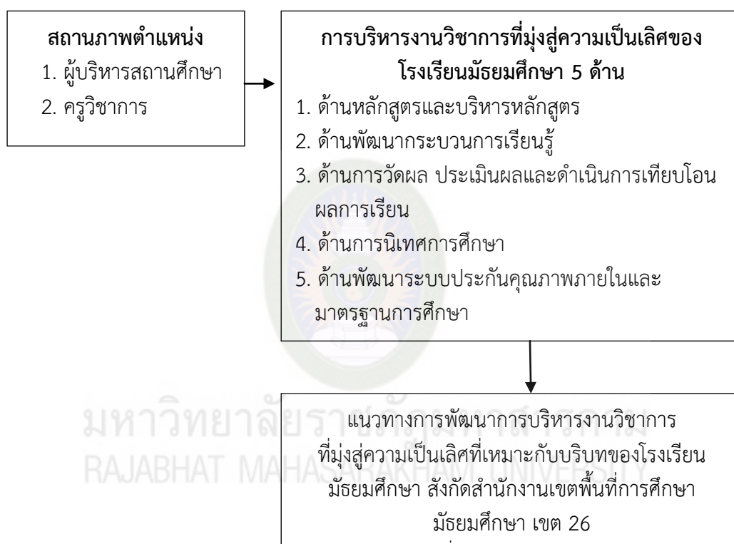
ภาพที่ 1.1 กรอบแนวคิดในการวิจัย

การวิจัยครั้งนี้ ผู้วิจัยมุ่งศึกษาความคิดเห็นของผู้บริหารและครูวิชาการเกี่ยวกับสภาพการบริหารงานวิชาการที่มุ่งสู่ความเป็นเลิศ และข้อเสนอแนะแนวทางการพัฒนาการบริหารงานวิชาการที่มุ่งสู่ความเป็นเลิศที่เหมาะสมกับบริบทของโรงเรียนมัธยมศึกษา สังกัดสำนักงานเขตพื้นที่การศึกษามัธยมศึกษา เขต 26 โดยยึดกรอบแนวคิดตามขอบข่ายและภารกิจการดำเนินงานวิชาการ จากการศึกษาสังเคราะห์ของผู้วิจัย ดังนี้