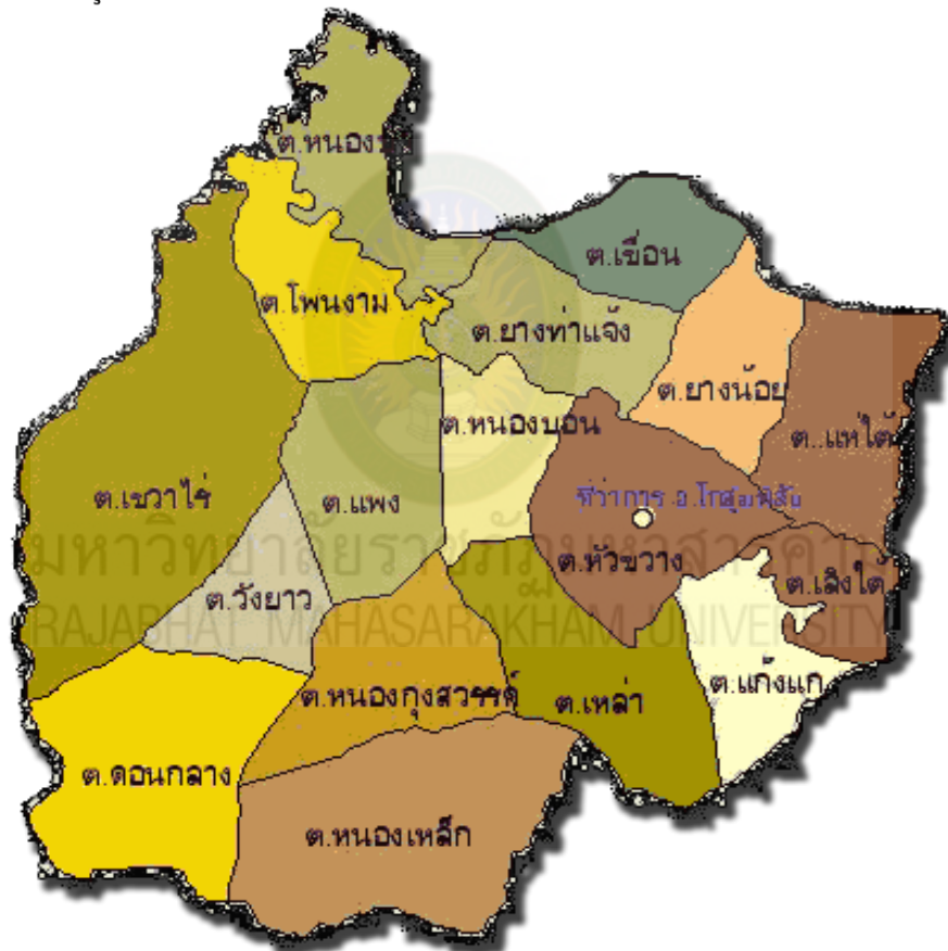
ภาพที่ 1 แผนที่อำเภอ โกสุมพิสัย (แผนพัฒนาชุมชนอำเภอโกสุมพิสัย)

อำเภอโกสุมพิสัย ตั้งอยู่ทางทิศตะวันตกเฉียงเหนือของจังหวัดมหาสารคาม อยู่ห่างจากจังหวัดมหาสารคาม 29 กิโลเมตร ตั้งอยู่บนเนินสูงหรือเรียกว่า “มอ” มีพื้นที่ 956.351 ตารางกิโลเมตร (527,719 ไร่) มีอาณาเขตติดต่อกับอำเภอต่าง ๆ ดังนี้