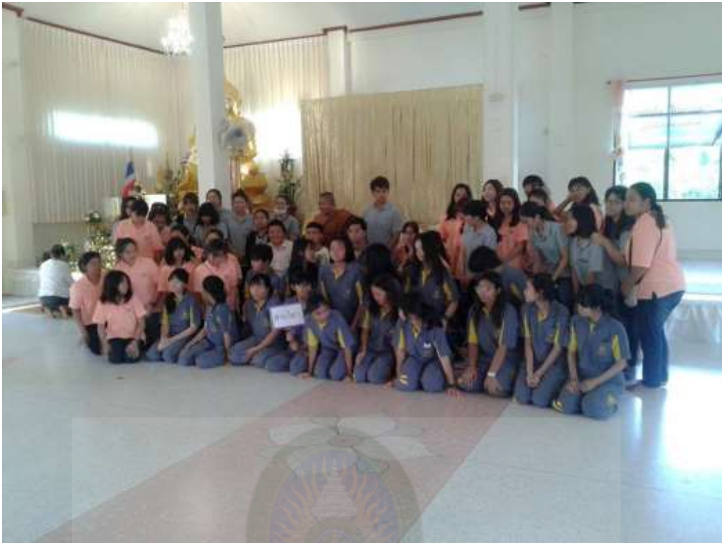
กิจกรรมอบรมพุทธศีลธรรมระดับชุมชนสำหรับเยาวชน