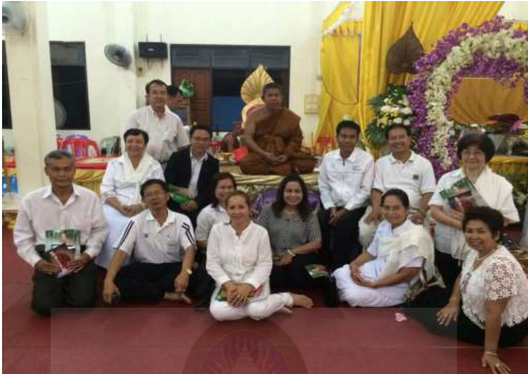
กิจกรรมอบรมทูตศีลธรรมระดับชุมชนสำหรับข้าราชการเกษียณ และประชาชนทั่วไป