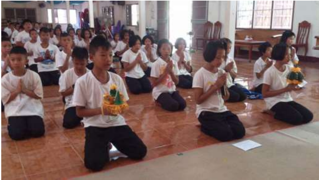
กิจกรรมอบรมทูตศีลธรรมระดับชุมชนสำหรับเยาวชน