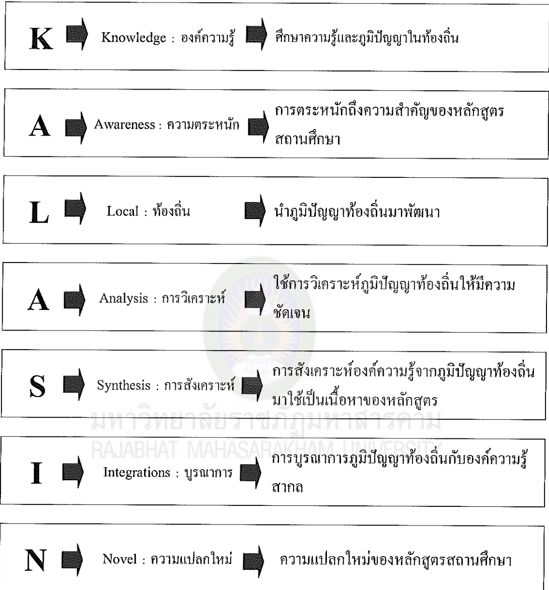
แผนภาพที่ 14 รูปแบบการบริหารหลักสูตรของโรงเรียนในสังกัดองค์การบริหารส่วนจังหวัดกาฬสินธุ์ “Kalasin Model”