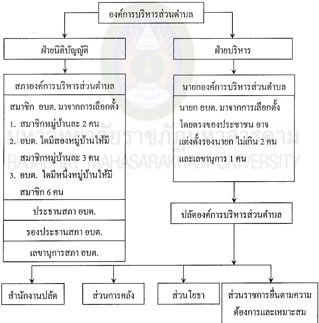
แผนภาพที่ 1 โครงสร้างการบริหารงานของ อบต. ตาม พ.ร.บ. สภาตำบลและ อบต. พ.ศ. 2537 แก้ไขเพิ่มเติมถึง (ฉบับที่ 5) พ.ศ. 2546

องค์การบริหารส่วนตำบล มาตรา 45 กำหนดให้สภาองค์การบริหารส่วนตำบลประกอบด้วย สมาชิกสภาองค์การบริหารส่วนตำบล จำนวนหมู่บ้านละสองคน ซึ่งเลือกตั้งขึ้นโดยราษฎรผู้มีสิทธิเลือกตั้งในแต่ละหมู่บ้านในเขตองค์การบริหารส่วนตำบลนั้น มาตรา 48 กำหนดให้สภาองค์การบริหารส่วนตำบลมีประธานสภา และรองประธานสภาคนหนึ่งซึ่งเลือกจากสมาชิกสภาองค์การบริหารส่วนตำบล มาตรา 58 กำหนดให้องค์การบริหารส่วนตำบลมีนายกองค์การบริหารส่วนตำบลคนหนึ่ง ซึ่งมาจากการเลือกตั้ง โดยตรงของประชาชน ตามกฎหมายว่าด้วยการเลือกตั้งสมาชิกสภาท้องถิ่นหรือผู้บริหารท้องถิ่น และมาตรา 60 กำหนดให้นายกองค์การบริหารส่วนตำบลควบคุมและรับผิดชอบในการบริหารราชการขององค์การบริหารส่วนตำบลตามกฎหมาย และเป็นผู้บังคับบัญชาของพนักงานส่วนตำบลและลูกจ้างขององค์การบริหารส่วนตำบล