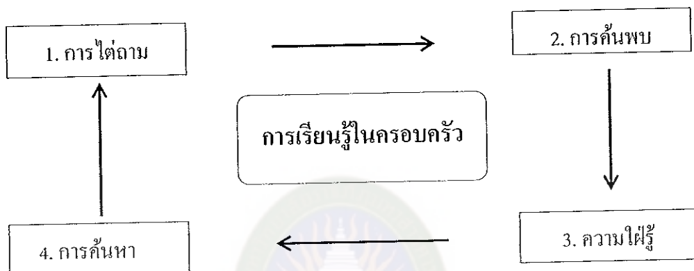
ภาพประกอบที่ 3 กระบวนการทางการศึกษาสำหรับการเรียนรู้ที่บ้านหรือครอบครัว ที่มา : Kay (1984 : 81) Social psychology in the 80s.

เคย์ Kay (1984 : 81-84) ได้เสนอแนวคิดเกี่ยวกับกระบวนการทางการศึกษาสำหรับการเรียนรู้ที่บ้านหรือครอบครัว โดยใช้แผนภาพ ดังภาพประกอบ