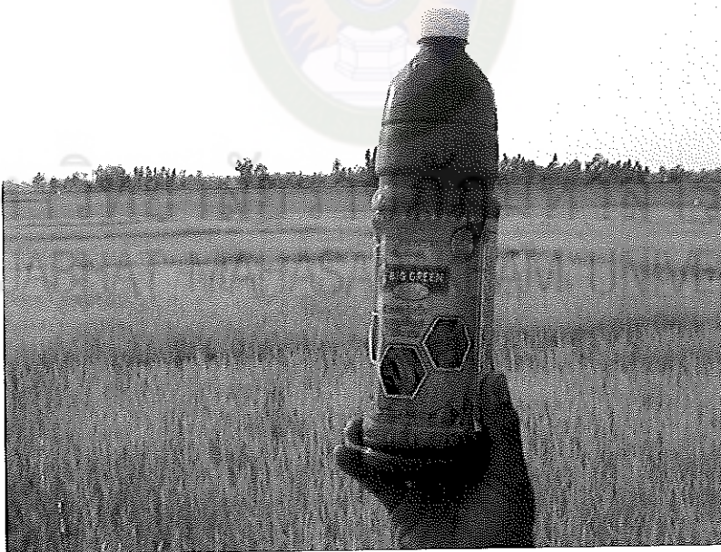
ภาพภาคผนวกที่ 4 ปุ๋ยสำหรับยีสี่เหลี่ยมแถมน้ำเงิน ของบริษัทอะโกรไบโอเมท จำกัด ใส่ในช่วงข้าวอายุได้ 15 วันหลังงอก อัตรา 1 ลิตร (ผสมน้ำ 30 ลิตร) ต่อไร่