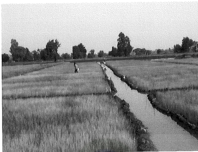
ภาพภาคผนวกที่ 19 สภาพแปลงข้าวหลังจากฉีดพ่นปุ๋ยสาหร่ายสีเขียวแกมน้ำเงิน เมื่อข้าวอายุ 1 เดือน ช่วงเดือนกุมภาพันธ์ พ.ศ. 2555 สภาพแปลงทดลอง