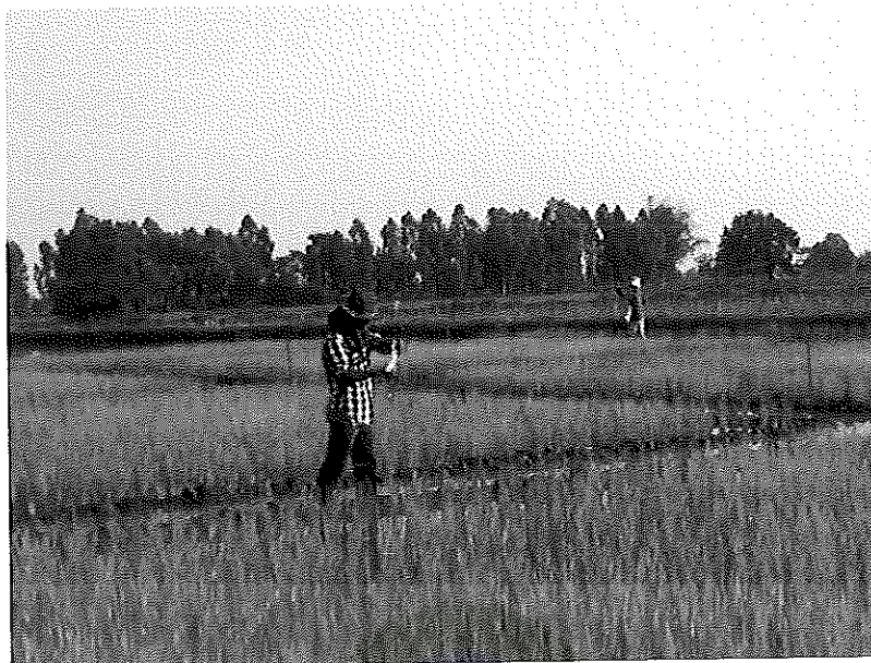
ภาพภาคผนวกที่ 17 ใส่ปุ๋ยเคมีตามกรรมวิธีการทดลองต่างๆ เมื่อข้าวอายุได้ 15 วันหลังออก ช่วงเดือนกุมภาพันธ์ พ.ศ. 2555 สภาพแปลงทดลอง