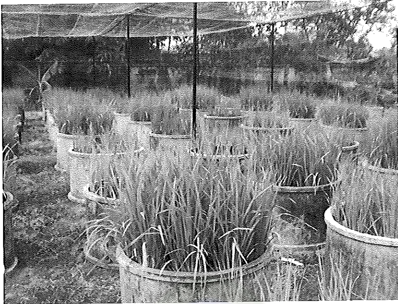
ภาพภาคผนวกที่ 5 ข้าวพันธุ์ชัยนาท 1 อายุ 60 วันหลังงอก ช่วงเดือนมีนาคม พ.ศ. 2555 ในสภาพเรือนทดลอง