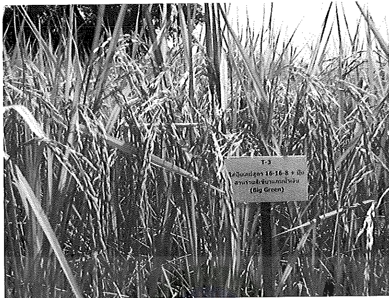
ภาพภาคผนวกที่ 25 ข้าวชัยนาท 1 อายุ 115 วันหลังออก ช่วงเดือนเมษายน พ.ศ. 2555

ในสภาพแปลงทดลองใส่ปุ๋ยสูตร 16-16-8 ร่วมกับสารรายสัปดาห์เขียวแถมน้ำเงิน