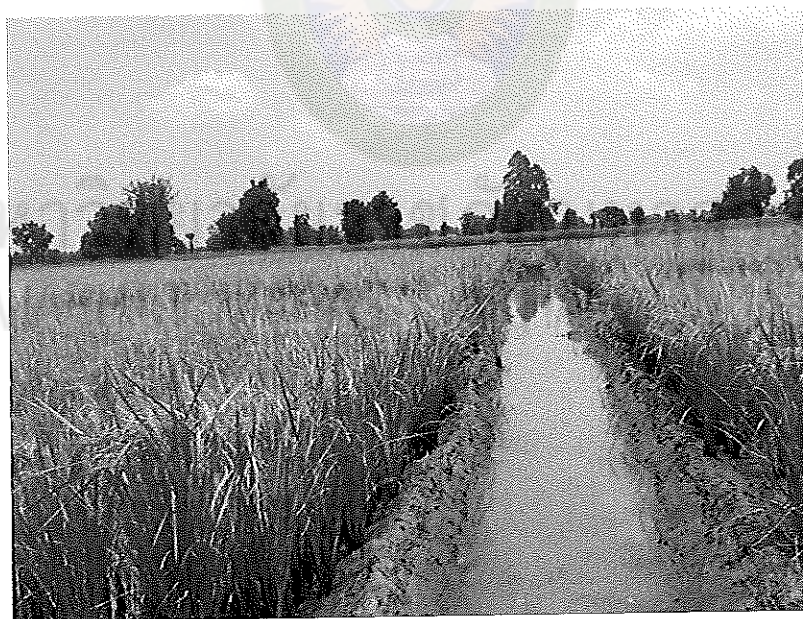
ภาพภาคผนวกที่ 22 ข้าวพันธุ์ชัยนาท 1 อายุ 115 วันหลังออก ช่วงเดือนเมษายน พ.ศ. 2555 ในสภาพแปลงทดลอง