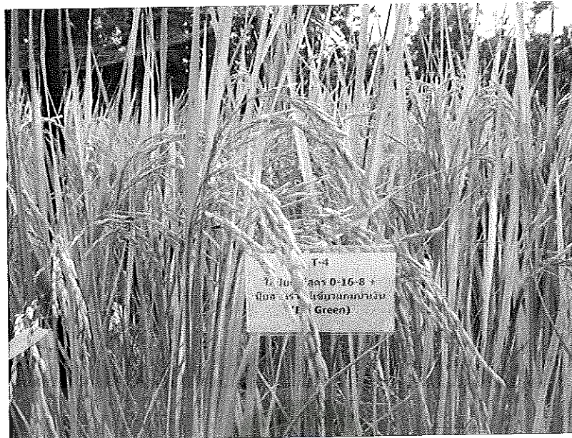
ภาพภาคผนวกที่ 11 ข้าวพันธุ์ชัยนาท 1 อายุ 115 วันหลังออก ช่วงเดือนพฤษภาคม พ.ศ. 2555 ในเรือนทดลองใส่ปุ๋ยสูตร 0-16-8 ร่วมกับสาหร่ายสีเขียวแกมน้ำเงิน