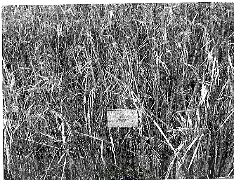
ภาพภาคผนวกที่ 23 ข้าวชัยนาท 1 อายุ 115 วันหลังออก ช่วงเดือนเมษายน พ.ศ. 2555 ในสภาพ แปลงทดลองไม่ได้ใส่ปุ๋ยเคมี (Control)