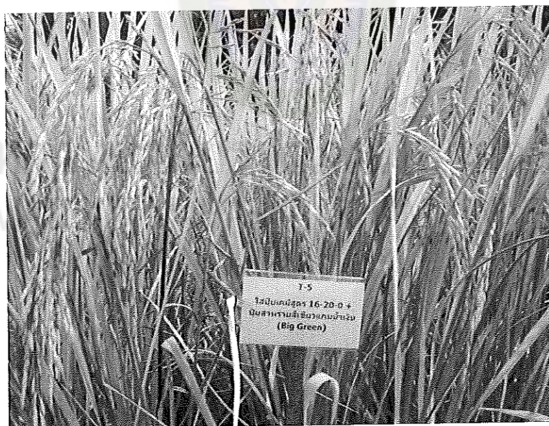
ภาพภาคผนวกที่ 12 ข้าวพันธุ์ชัยนาท 1 อายุ 115 วันหลังออก ช่วงเดือนพฤษภาคม พ.ศ. 2555 ในสภาพเรือนทดลองใส่ปุ๋ยสูตร 16-20-0 ร่วมกับสาหร่ายสีเขียวแกมน้ำเงิน