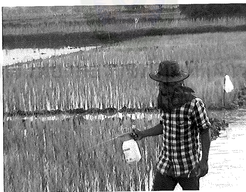
ภาพภาคผนวกที่ 18 การฉีดพ่นปุ๋ยสาหร่ายสีเขียวแกมน้ำเงินอัตรา 1 ลิตร (ผสมน้ำ 30 ลิตร) ต่อไร่ เมื่อข้าวอายุได้ 15 วันหลังออก ช่วงเดือนกุมภาพันธ์ พ.ศ. 2555 สภาพแปลงทดลอง