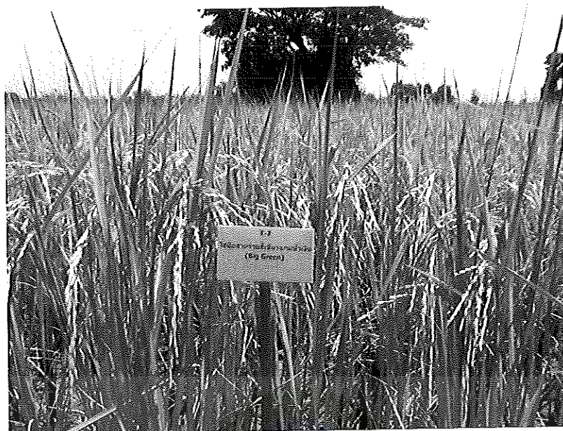
ภาพภาคผนวกที่ 29 ข้าวชัชวาท 1 อายุ 115 วันหลังออก ช่วงเดือนเมษายน พ.ศ. 2555

ใส่สารร้ายสี่เขียวแถมน้ำเงินเพียงอย่างเดียว อัตรา 1 ลิตร (ผสมน้ำ 30 ลิตร) ต่อไร่ ในสภาพแปลงทดลอง