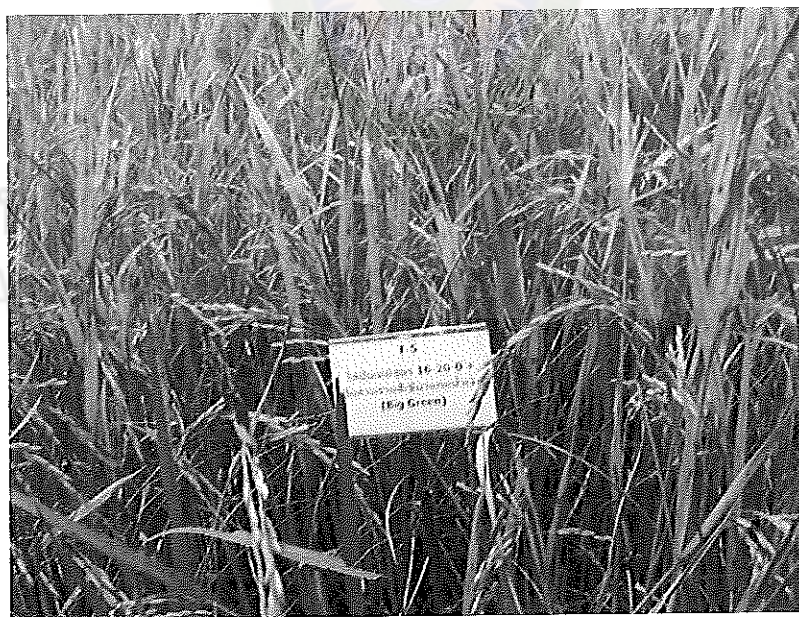
ภาพภาคผนวกที่ 26 ข้าวชัยนาท 1 อายุ 115 วันหลังออก ช่วงเดือนเมษายน พ.ศ. 2555

ในสภาพแปลงทดลองใส่ปุ๋ยสูตร 16-16-8 ร่วมกับสารรายสัปดาห์เขียวแถมน้ำเงิน