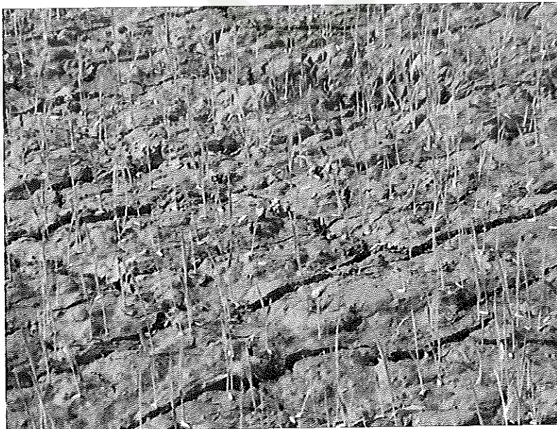
ภาพภาคผนวกที่ 16 เมล็ดข้าวพันธุ์ชัยนาท 1 อายุ 10 วันหลังงอก ช่วงเดือนกุมภาพันธ์ พ.ศ. 2555 สภาพแปลงทดลอง