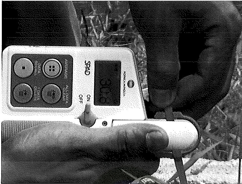
ภาพภาคผนวกที่ 7 เครื่องวัดค่า Spad chlorophyll meter reading (SCMR) สำหรับเก็บข้อมูลปริมาณ คลอโรฟิลล์ทางอ้อม ช่วงเดือนมีนาคม พ.ศ. 2556 ในสภาพเรือนทดลอง