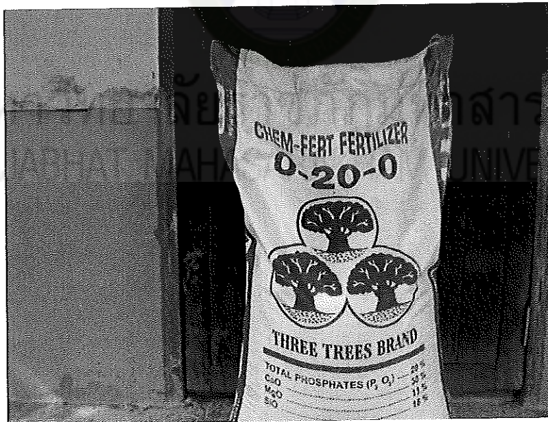
ภาพภาคผนวกที่ 2 ปุ๋ยเคมีสูตร 0-20-0 ของบริษัทวาย.วี.พี.เฟอर्टิไลเซอร์ จำกัด ใส่ในช่วงข้าวอายุ 15 วันหลังงอก อัตรา 30.0 กิโลกรัมต่อไร่