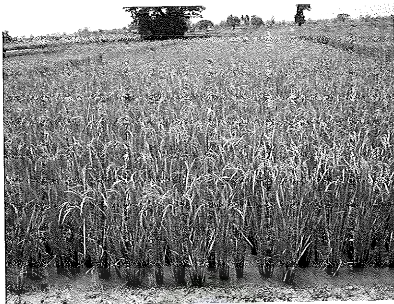
ภาพภาคผนวกที่ 21 ข้าวพันธุ์ชัยนาท 1 อายุ 105 วันหลังออก ช่วงเดือนเมษายน พ.ศ. 2555 ในสภาพแปลงทดลอง