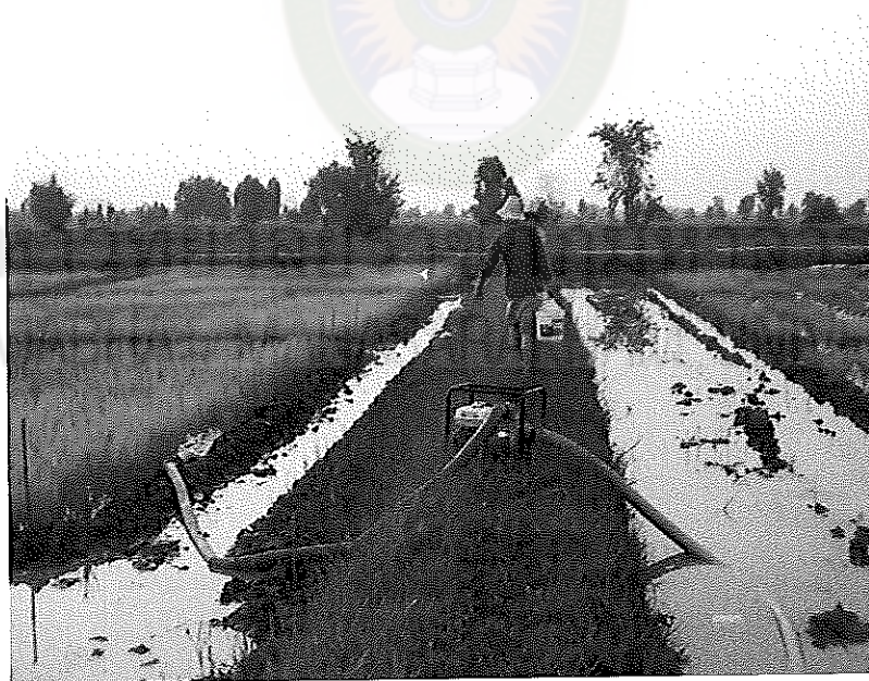
ภาพภาคผนวกที่ 20 การจัดการน้ำในแปลงนาข้าว เมื่อข้าวอายุได้ 1 เดือน สภาพแปลงทดลอง