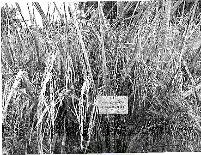
ภาพภาคผนวกที่ 9 ข้าวพันธุ์ชัยนาท 1 อายุ 115 วันหลังงอก ช่วงเดือนพฤษภาคม พ.ศ. 2555

ในเรือนทดลองใส่ปุ๋ยสูตร 16-16-0 และสูตร 46-0-0