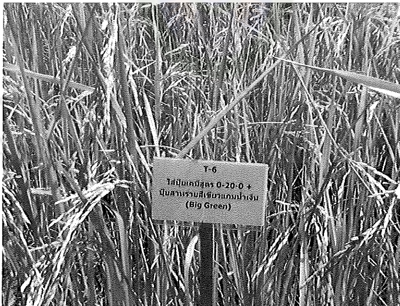
ภาพภาคผนวกที่ 28 ข้าวชัยนาท 1 อายุ 115 วันหลังออก ช่วงเดือนเมษายน พ.ศ. 2555

ในสภาพแปลงทดลองใส่ปุ๋ยสูตร 0-16-8 ร่วมกับสาหร่ายสีเขียวแถมน้ำเงิน