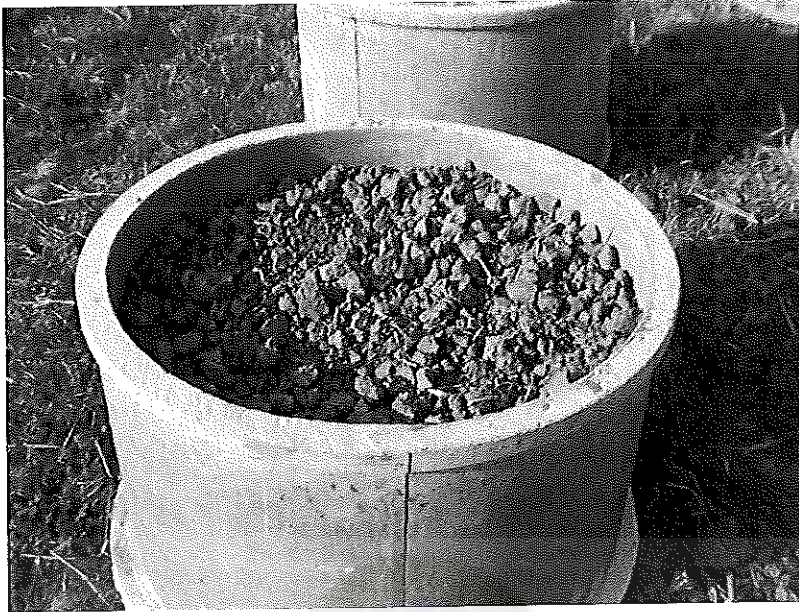
ภาพภาคผนวกที่ 1 การเตรียมดินใส่ดินร่วนปนทรายในบล็อกรซีเมนต์ขนาดเส้นผ่าศูนย์กลาง 80 เซนติเมตร สูง 50 เซนติเมตร ก่อนปลูกข้าวในสภาพเรือนทดลอง คณะเทคโนโลยีการเกษตร มหาวิทยาลัยราชภัฏมหาสารคาม