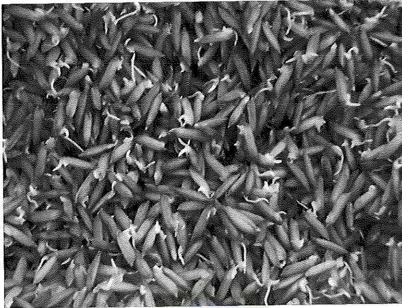
ภาพภาคผนวกที่ 15 เมล็ดข้าวพันธุ์ชัยนาท 1 อายุ 1 วันหลังจากแช่น้ำ ช่วงเดือนมกราคม พ.ศ. 2555 ข้าวที่งอกพร้อมหว่านในแปลงปลูกข้าวในสภาพแปลงทดลอง