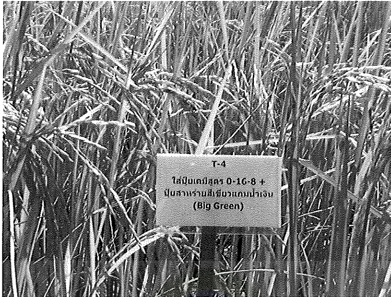
ภาพภาคผนวกที่ 27 ข้าวชัยนาท 1 อายุ 115 วันหลังออก ช่วงเดือนเมษายน พ.ศ. 2555

ในสภาพแปลงทดลองใส่ปุ๋ยสูตร 0-16-8 ร่วมกับสาหร่ายสีเขียวแถมน้ำเงิน