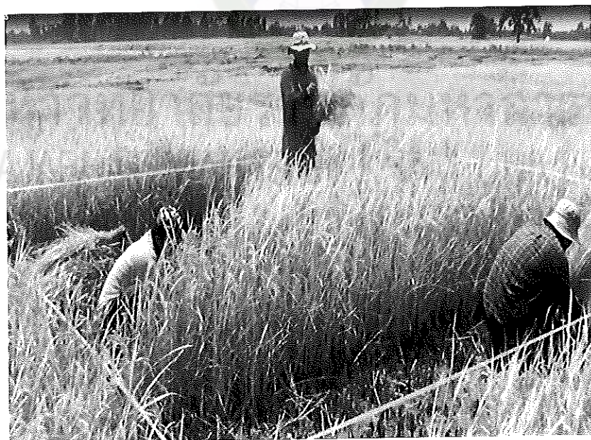
ภาพภาคผนวกที่ 30 การเก็บเกี่ยวผลผลิตข้าวพันธุ์ชัชวาท 1 อายุ 120 วันหลังออก ในสภาพแปลง ทดลองบ้านเหล่าพ้อหา ตำบลเขวาไร่ อำเภอโกสุมพิสัย จังหวัดมหาสารคาม ในช่วงหน้าแล้งปี พ.ศ. 2555

ใส่สารร้ายสี่เขียวแถมน้ำเงินเพียงอย่างเดียว อัตรา 1 ลิตร (ผสมน้ำ 30 ลิตร) ต่อไร่ ในสภาพแปลงทดลอง