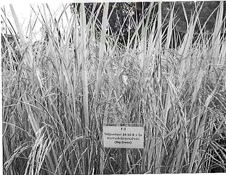
ภาพภาคผนวกที่ 10 ข้าวพันธุ์ชัยนาท 1 อายุ 115 วันหลังงอก ช่วงเดือนพฤษภาคม พ.ศ. 2555

ในเรือนทดลองใส่ปุ๋ยสูตร 16-16-0 และสูตร 46-0-0