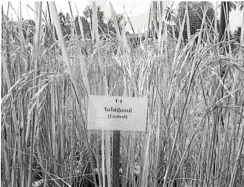
ภาพภาคผนวกที่ 8 ข้าวพันธุ์ชัยนาท 1 อายุ 115 วันหลังออก ช่วงเดือนพฤษภาคม พ.ศ. 2555 ในเรือนทดลองไม่ได้ใส่ปุ๋ยเคมี (Control)