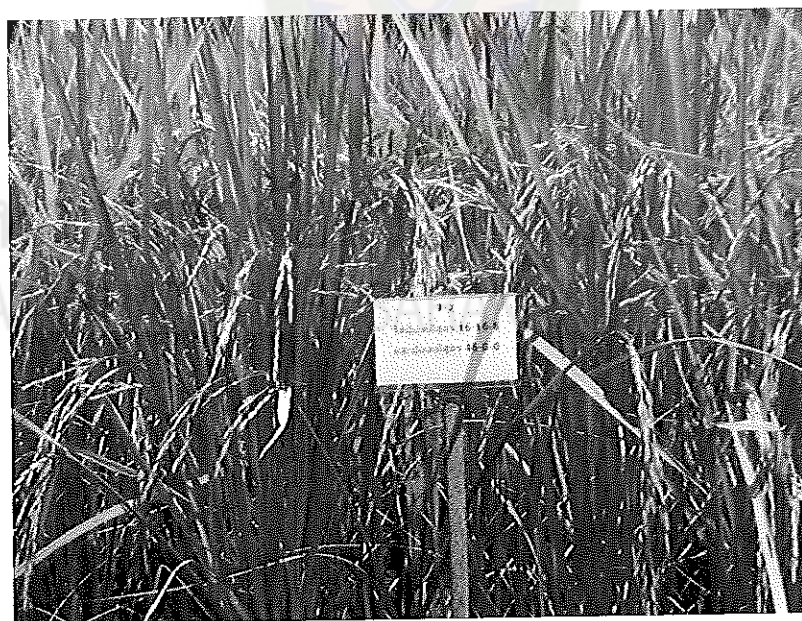
ภาพภาคผนวกที่ 24 ข้าวชัยนาท 1 อายุ 115 วันหลังออก ช่วงเดือนเมษายน พ.ศ. 2555 ในสภาพแปลงทดลองใส่ปุ๋ยสูตร 16-16-8 และสูตร 46-0-0