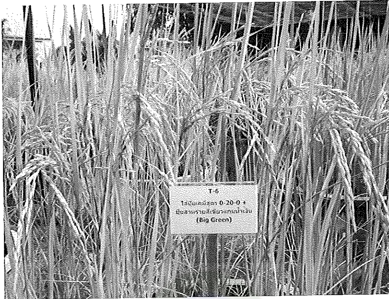
ภาพภาคผนวกที่ 13 ข้าวพันธุ์ชัยนาท 1 อายุ 115 วันหลังออก ช่วงเดือนพฤษภาคม พ.ศ. 2555 ในเรือนทดลองใส่ปุ๋ยสูตร 0-20-0 ร่วมกับสารรายสีเขียวเกมน้ำเงิน