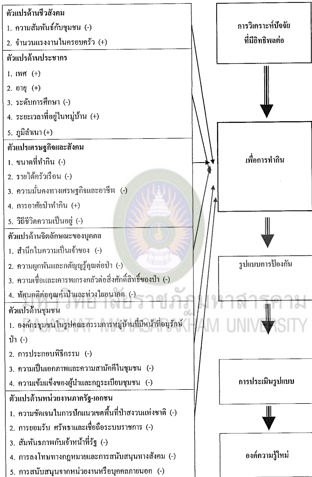
แผนภาพที่ 4 กรอบแนวคิดการวิจัย