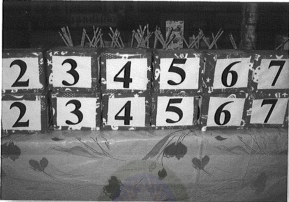
ภาพภาคผนวกที่ 5 ผลงานการประดิษฐ์การเรียนรู้