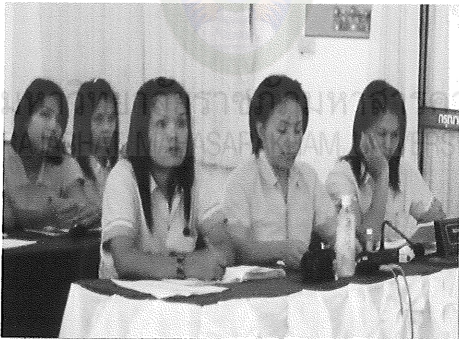
ภาพภาคผนวกที่ 2 กิจกรรมการประชุมเชิงปฏิบัติการครูผู้ดูแลเด็ก