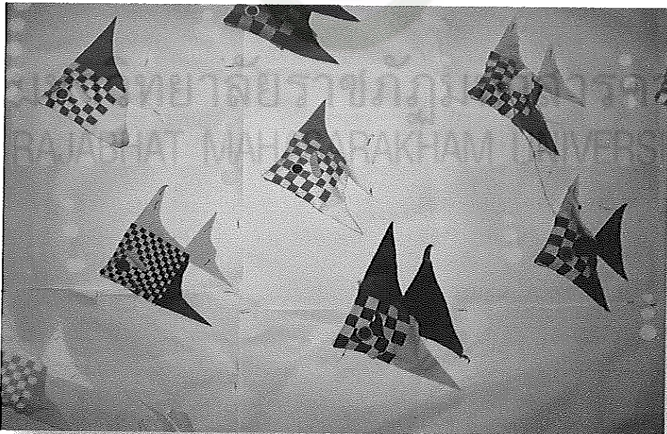
ภาพภาคผนวกที่ 6 ผลงานการประดิษฐ์การเรียนรู้