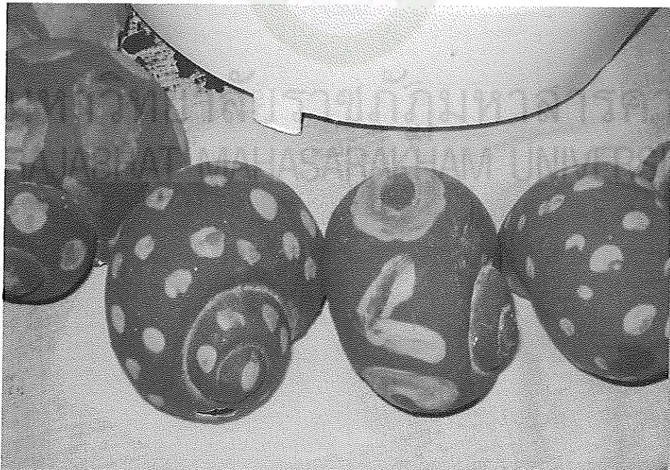
ภาพภาคผนวกที่ 4 ผลงานการประดิษฐ์การเรียนรู้