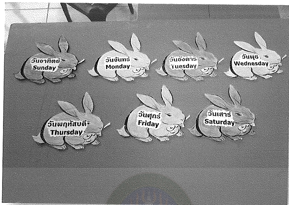
ภาพภาคผนวกที่ 7 ผลงานการผลิตสื่อการเรียนรู้