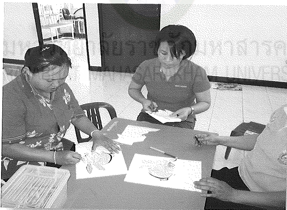
ภาพภาคผนวกที่ 8 กิจกรรมการผลิตสื่อการเรียนรู้