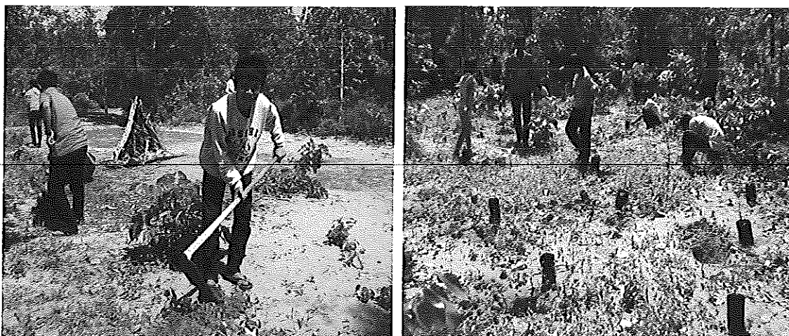
ภาพที่ ข-3 การปลูกป่าทดแทน