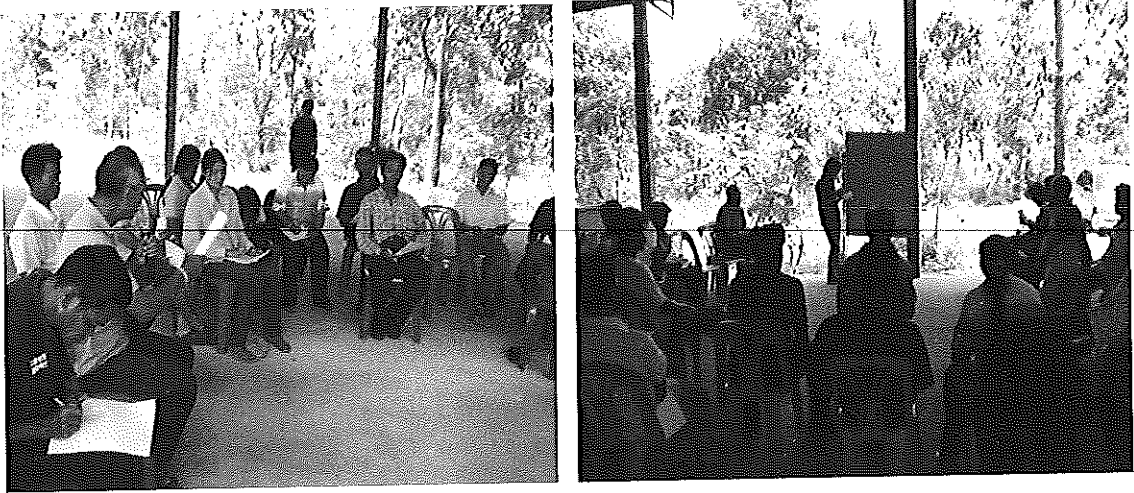
ภาพที่ ข-1 การเสริมสร้างความรู้ความเข้าใจและการมีส่วนร่วมของประชาชนในการอนุรักษ์ป่าชุมชนโคกใหญ่