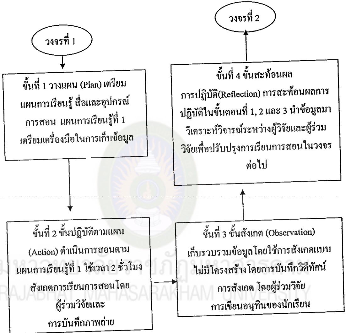
ภาพประกอบที่ 9 ขั้นตอนการดำเนินการวิจัยปฏิบัติการ

เพื่อให้เห็นขั้นตอนที่เด่นชัด ผู้วิจัยขอเสนอแผนภูมิขั้นตอนการดำเนินการวิจัย ปฏิบัติการวงจรที่ 1 ดังภาพประกอบที่ 9