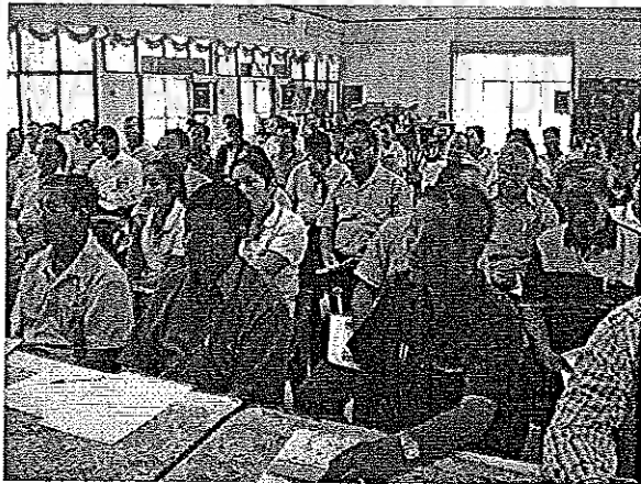
จัดอบรมรูปแบบการพัฒนาสหกรณ์กิจกรรมการฝึกรออม วันที่ 8 มกราคม 2552