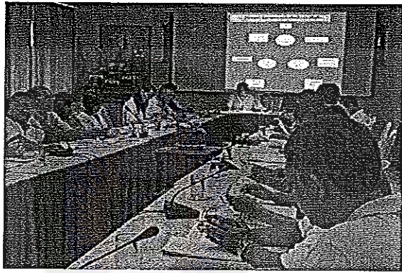
ประชุมชี้แจงรูปแบบการพัฒนาสหกรณ์กิจกรรมการออมทรัพย์ วันที่ 6 มกราคม 2552