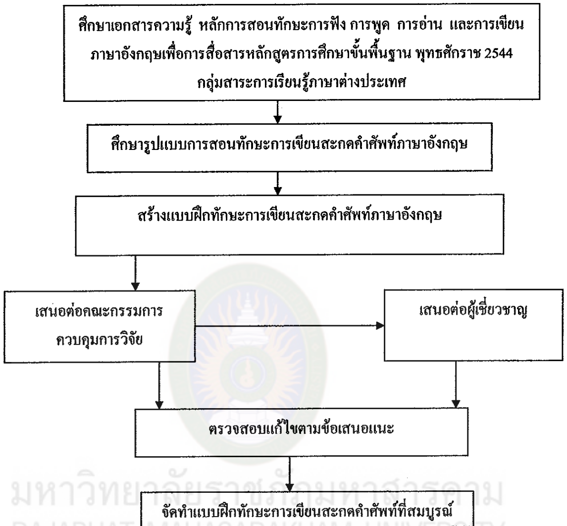
แผนภูมิที่ 2 ขั้นตอนวิธีสร้างแบบฝึกทักษะการเขียนสะกดคำศัพท์ภาษาอังกฤษ