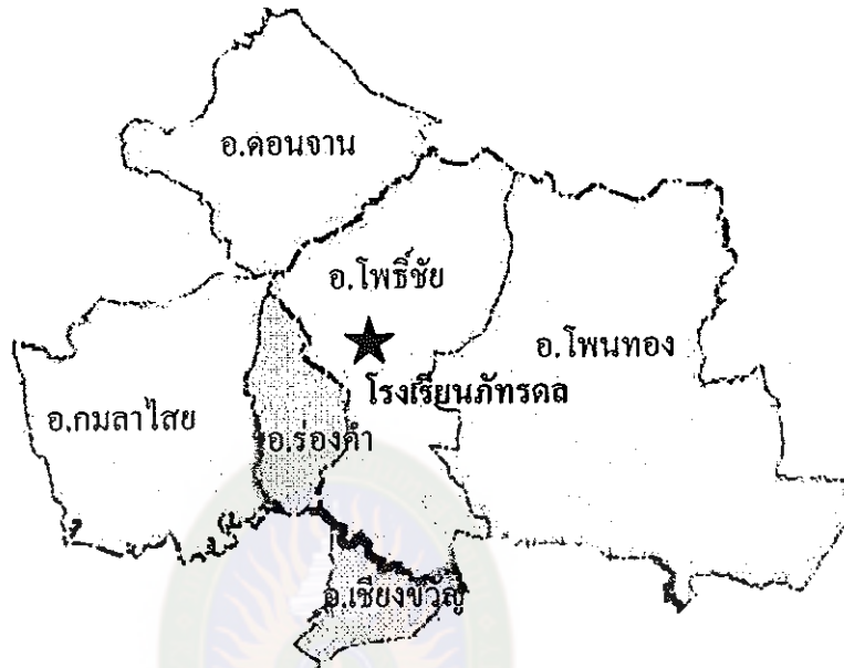
ภาพที่ 2 แผนที่เขตบริการของโรงเรียนภัทรคด

สรุปได้ว่า โรงเรียนภัทรคดเป็นโรงเรียนเอกชน ประเภทสามัญที่ก่อตั้งขึ้นใหม่ เปิดทำการเรียนการสอนเมื่อปีการศึกษา 2549 จัดการเรียนการสอนตั้งแต่ชั้นประถมศึกษาปีที่ 1-6 มีจำนวนนักเรียน 354 คน บุคลากรทั้งสิ้น 21 คน ประกอบด้วย ผู้บริหาร 3 คน ครู 15 คน โรงเรียนได้ยึดปรัชญาเป็นนโยบายหลักใช้เป็นแนวทางในการพัฒนาโรงเรียน โดยมุ่งที่จะอบรมสั่งสอนนักเรียนให้มีพัฒนาการที่ดีทั้งด้านร่างกายและจิตใจ เป็นคนดีมีคุณธรรมจริยธรรมเน้นให้เด็กมีความรู้ทางด้านวิชาการ มีความพร้อมที่จะรับเทคโนโลยีต่าง ๆ ใช้เทคโนโลยีอย่างมีคุณภาพ และใช้ชีวิตอยู่ในสังคมอย่างมีความสุข