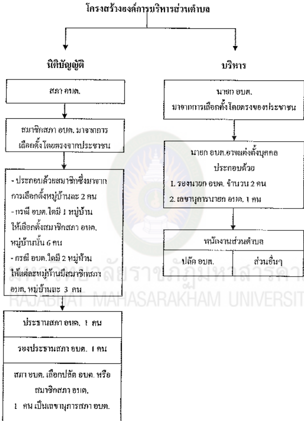
แผนภูมิที่ 1 โครงสร้างขององค์การบริหารส่วนตำบลตามพระราชบัญญัติสภาตำบลและองค์การบริหารส่วนตำบล พ.ศ. 2537 แก้ไขเพิ่มเติม (ฉบับที่ 5) พ.ศ. 2546