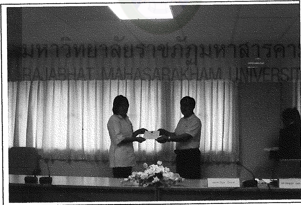
มอบเกียรติบัตรแก่ผู้ร่วมศึกษา