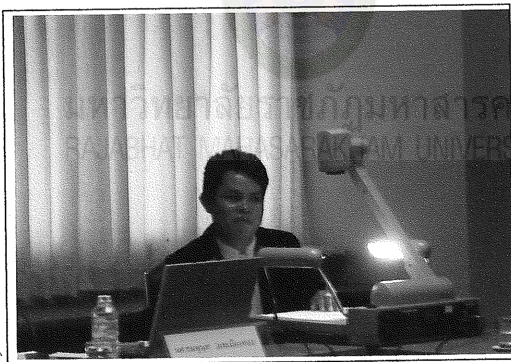
ตัวแทนกลุ่มย่อยกลุ่มที่ 2 นำเสนอผลการสัมมนากลุ่มย่อย