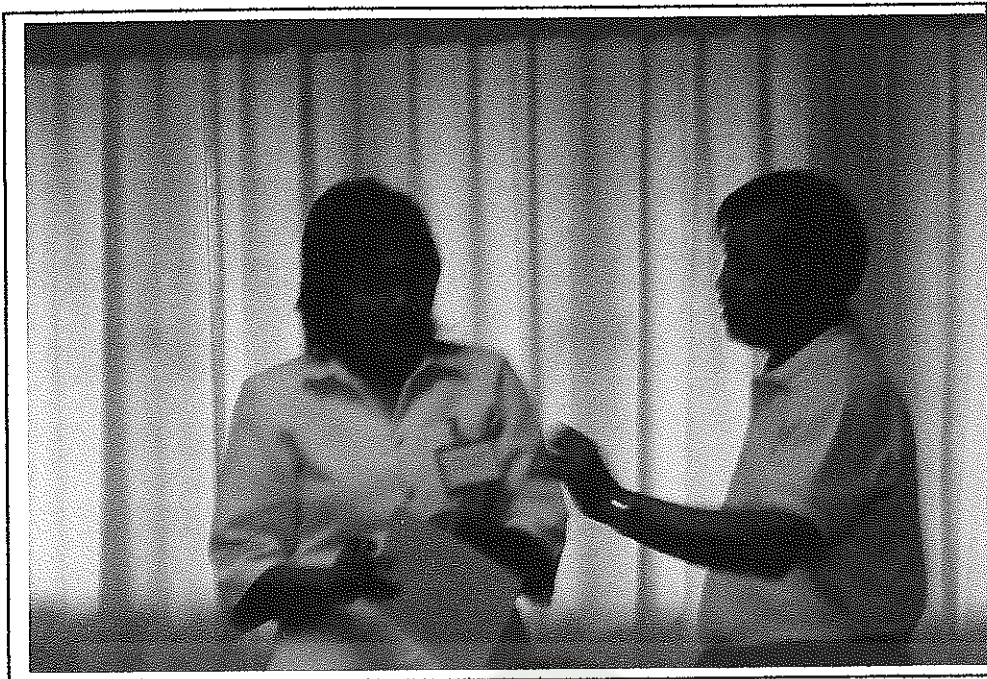
ผู้ร่วมศึกษาสอบถามความรู้เพิ่มเติมหลังการประชุมเชิงปฏิบัติการ