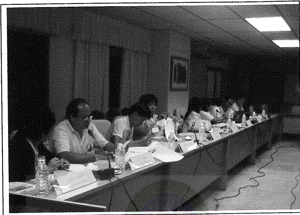
บรรยากาศการประชุมเชิงปฏิบัติการ