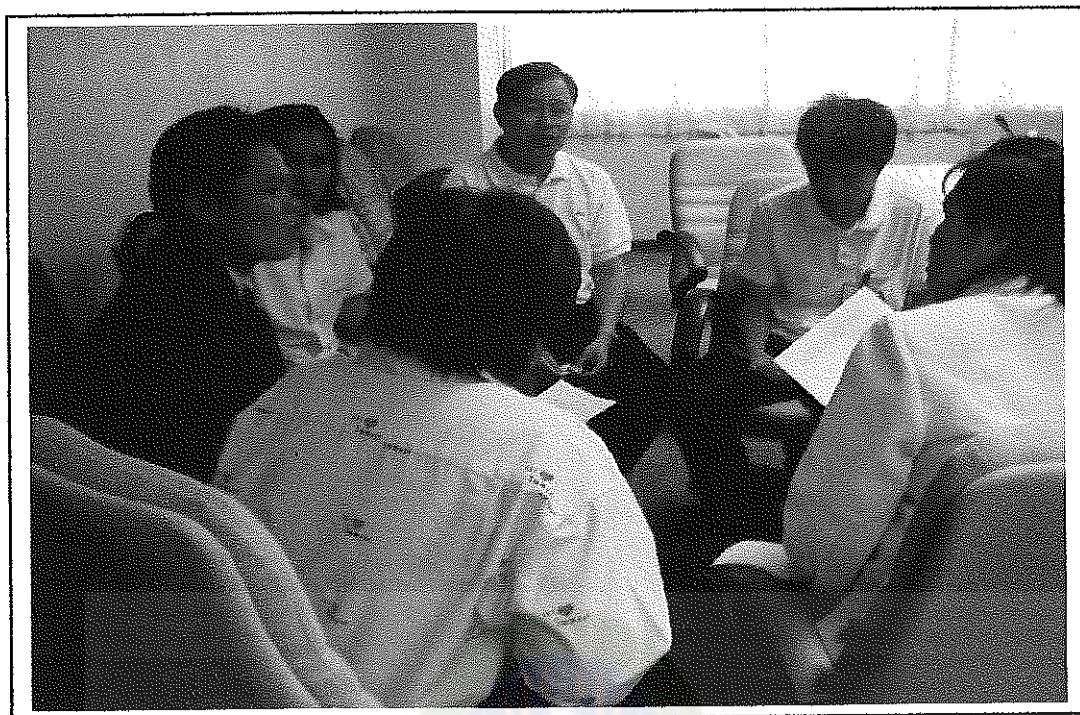
ผู้ร่วมศึกษา ระดมความเห็นกลุ่มย่อย