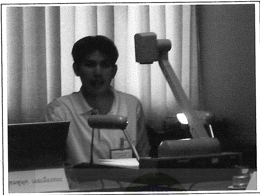
ตัวแทนกลุ่มย่อยกลุ่มที่ 1 นำเสนอผลการสัมมนากลุ่มย่อย