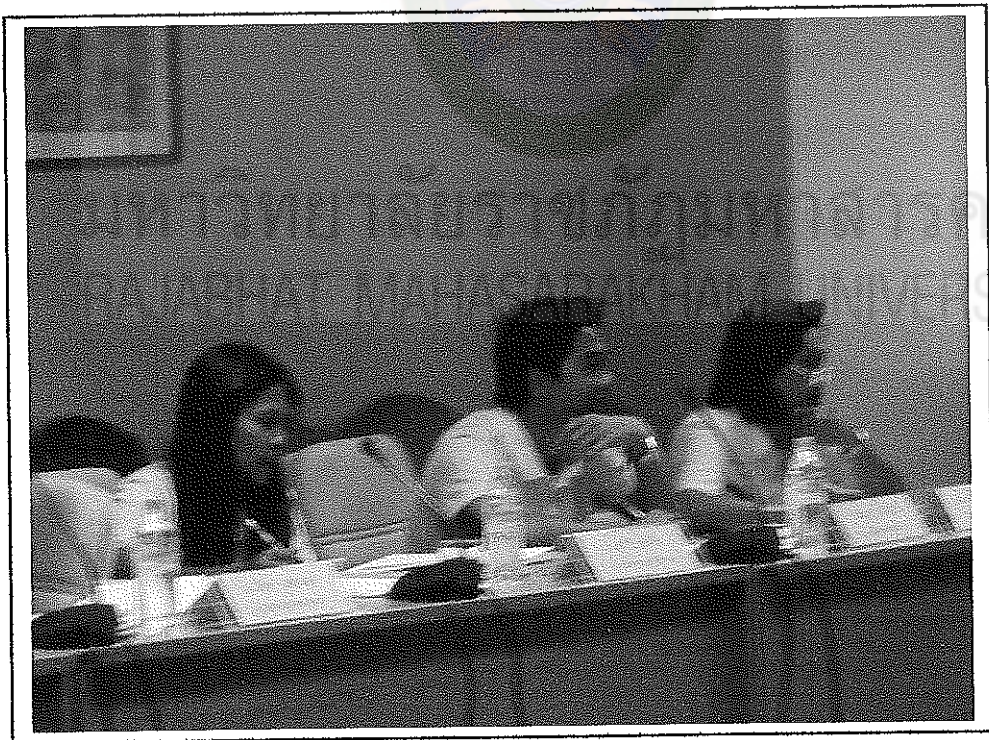
บรรยากาศการประชุมเชิงปฏิบัติการ