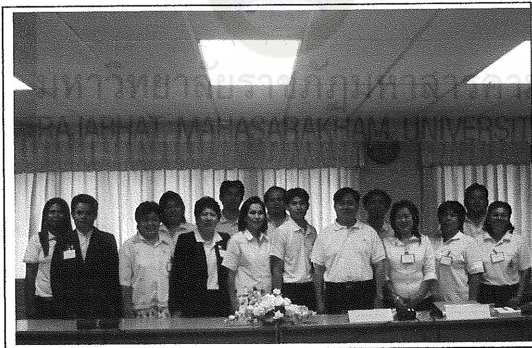
ผู้ร่วมศึกษาและผู้วิจัย