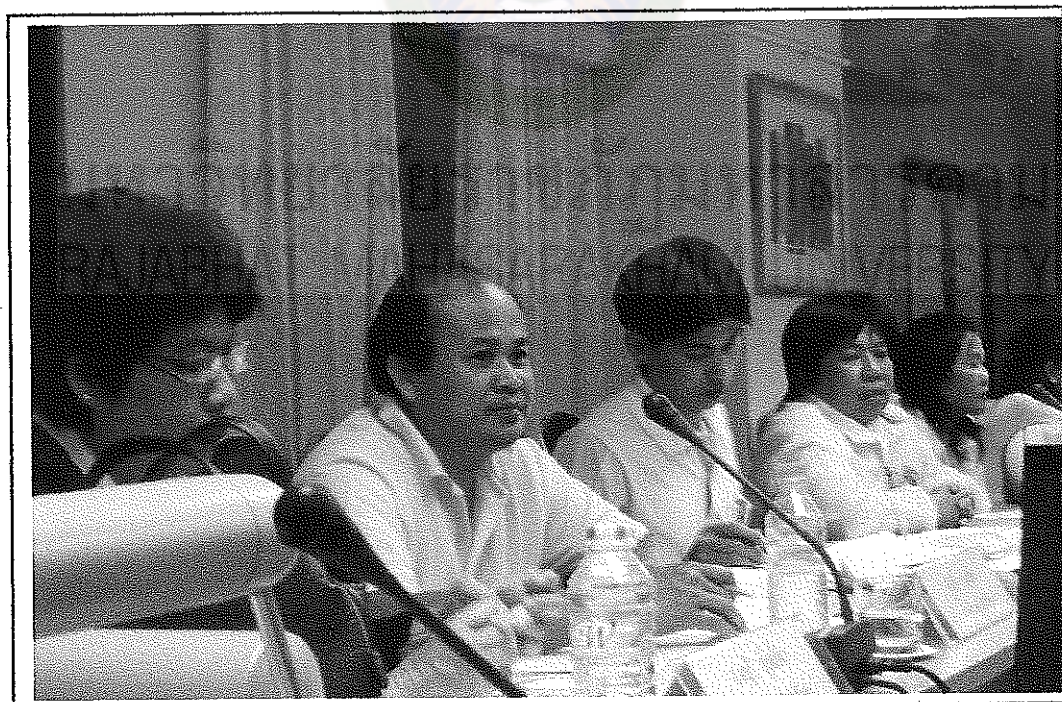
บรรยากาศการประชุมเชิงปฏิบัติการ