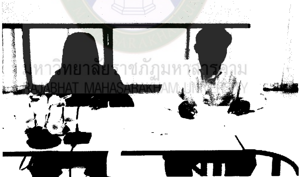
ภาพที่ 2 ผู้วิจัยและผู้ช่วยนักวิจัยรวบรวมและสรุปข้อมูลจากการเสวนา ครั้งที่ 1