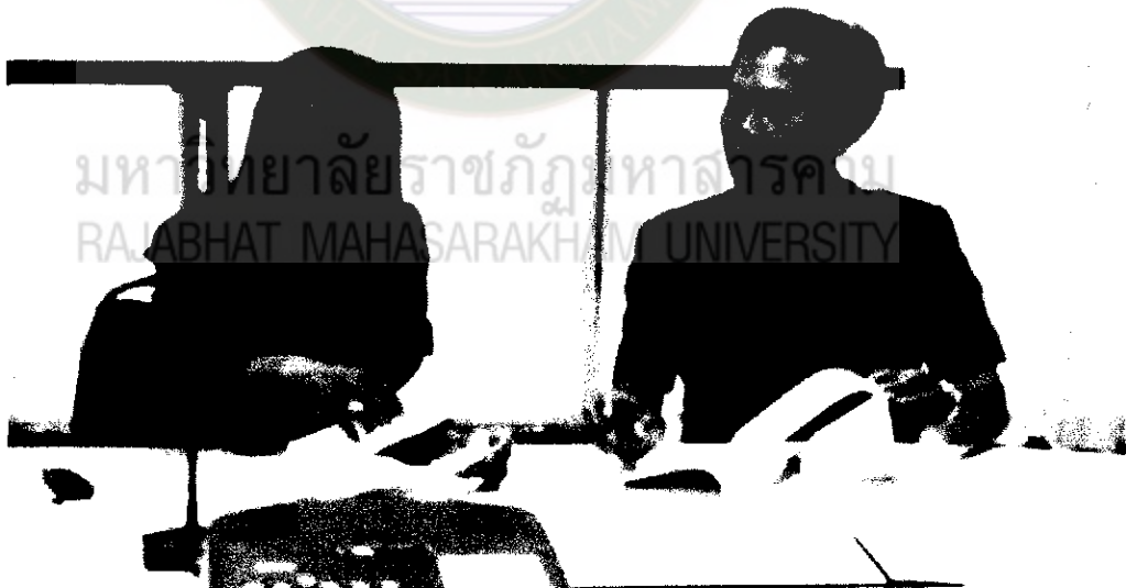
ภาพที่ 8 ผู้วิจัยสรุปประเด็นจากการเสวนาครั้งที่ 2