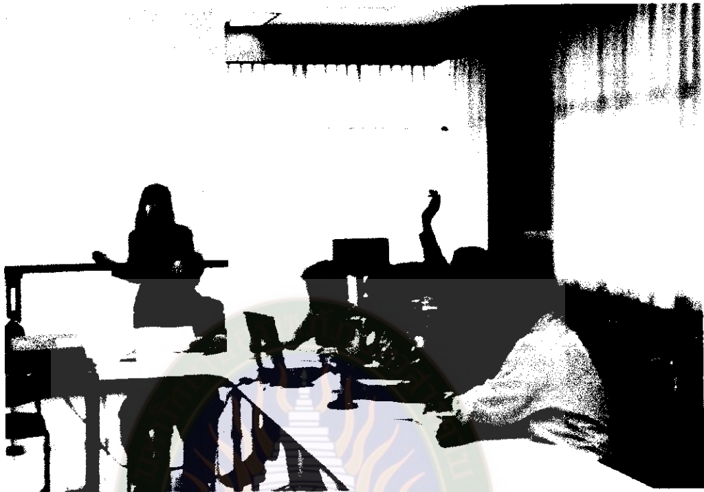
ภาพที่ 5 ชกมือสนับสนุนเห็นด้วย