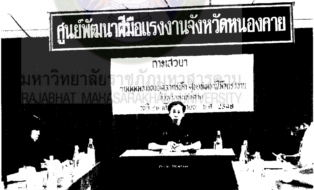
ภาพที่ 12 ผู้อำนวยการศูนย์พัฒนาฝีมือแรงงานจังหวัดหนองคายสรุปและนำเสนอแผนปฏิบัติการพัฒนาบุคลากรฝึก (เสวนาครั้งที่ 3)