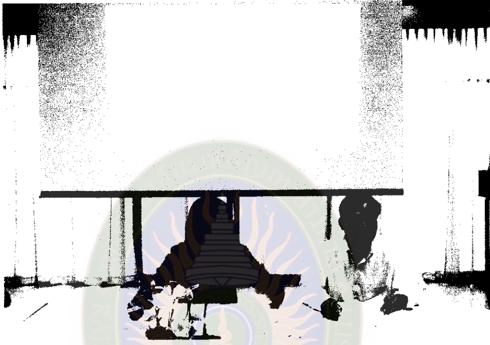
ภาพที่ 1 ผู้วิจัยชี้แจงจุดประสงค์ในการทำวิจัยและการจัดเสวนา