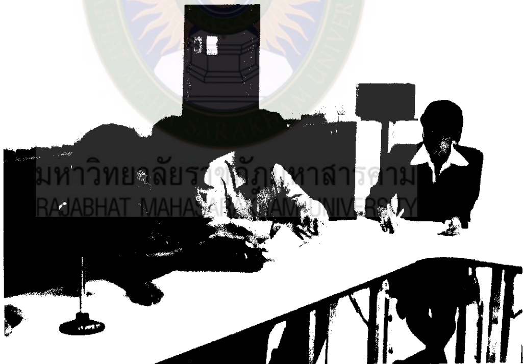
ภาพที่ 6 หาข้อมูลสนับสนุนถึงความเป็นไปได้