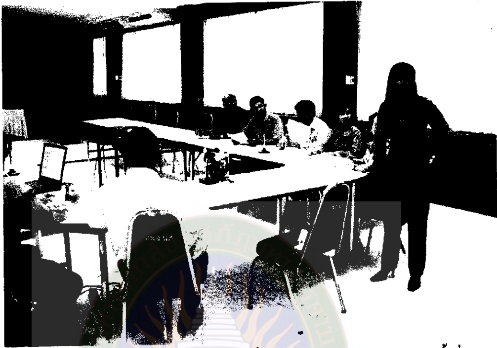
ภาพที่ 3 สรุปเสนอเกณฑ์พิจารณาครูฝึกที่มีประสิทธิภาพ จากการเสวนา ครั้งที่ 1