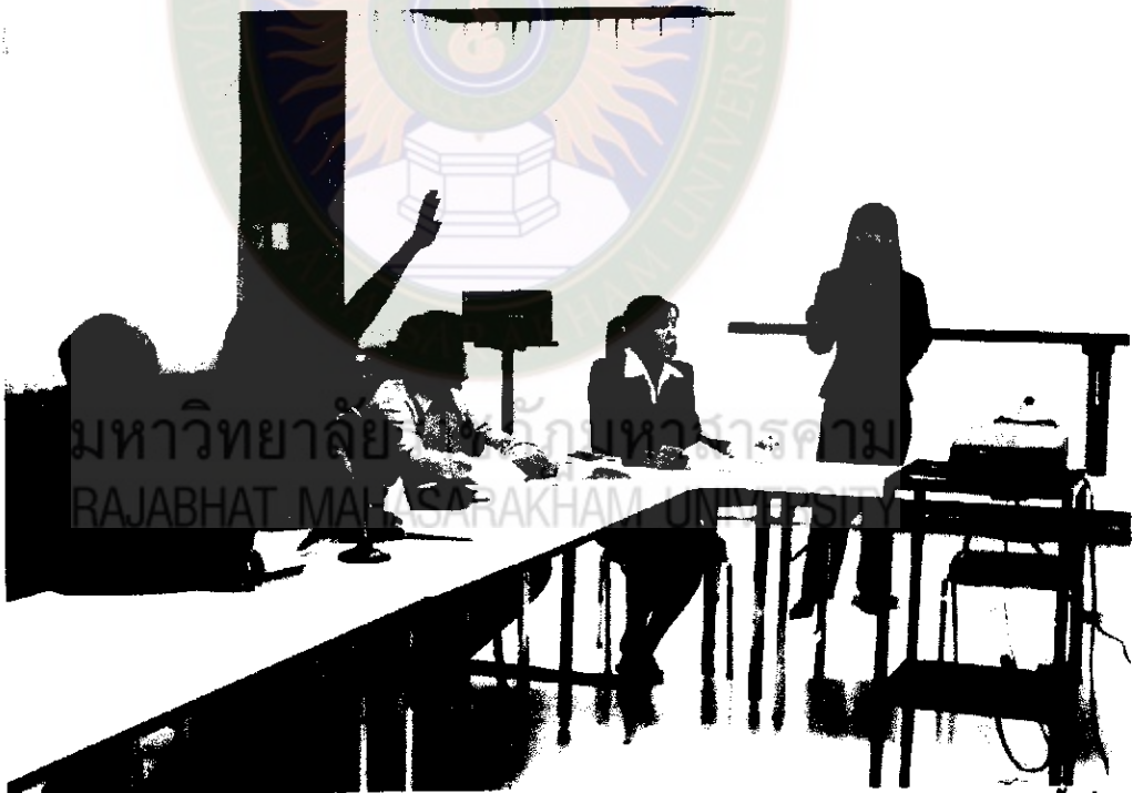
ภาพที่ 4 แสดงความคิดเห็นถึงรูปแบบที่เหมาะสมในการพัฒนาบุคลากรฝึก (เสวนาครั้งที่ 2)