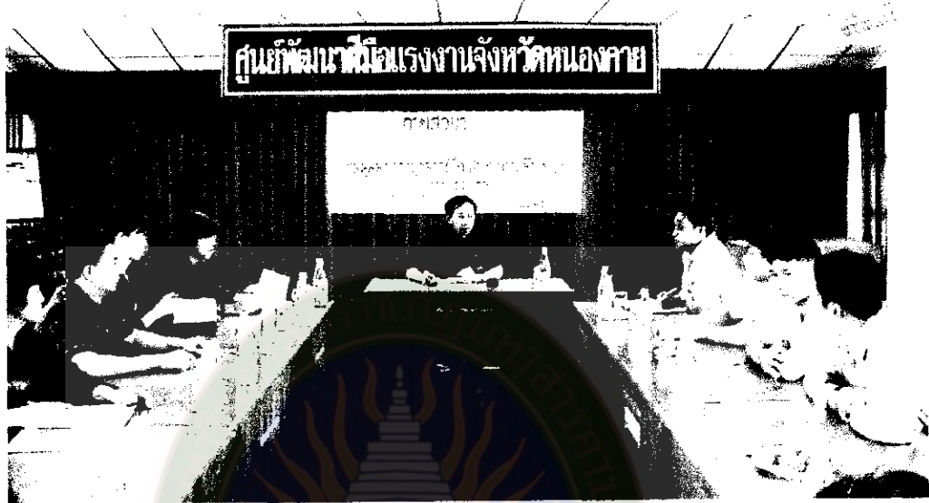
ภาพที่ 11 วิพากษ์และปรับปรุงถึงความเป็นไปได้ของแผนปฏิบัติการของการพัฒนาบุคลากรฝึก (เสวนาครั้งที่ 3)