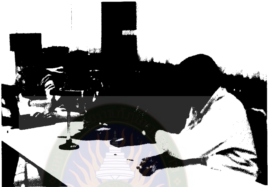
ภาพที่ 7 ชี้แจงให้เข้าใจตรงกัน