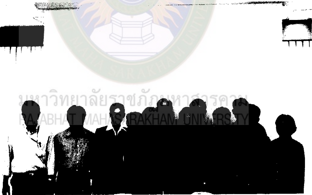
ภาพที่ 10 อาจารย์ร่วมกันหลังจากเสร็จสิ้นการเสวนา