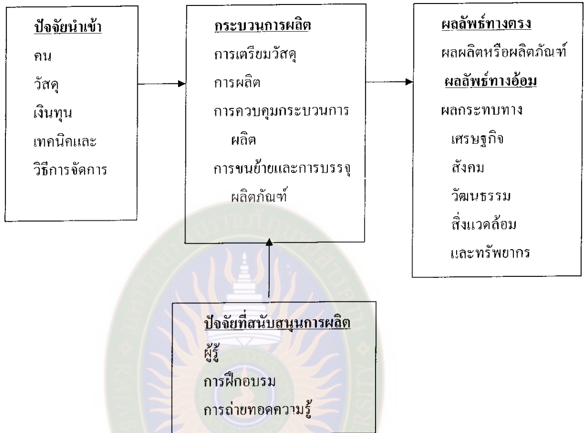
แผนภูมิที่ 2 โครงสร้างกระบวนการผลิตของชุมชน

สรุปได้ว่า กระบวนการผลิต หมายถึง การนำทรัพยากรหรือวัตถุดิบมาจัดสรรโดยผ่านกระบวนการที่เหมาะสม แล้วจะได้ผลผลิตออกมา ประกอบด้วย ปัจจัยนำเข้า ได้แก่ คน วัสดุ เงินทุน เทคนิคและวิธีการจัดการ กระบวนการผลิต ได้แก่ การเตรียมวัสดุ การผลิต การควบคุมกระบวนการผลิต การขนย้ายและการบรรจุผลิตภัณฑ์ ผลผลิตหรือผลลัพธ์ทางตรง ได้แก่ ผลผลิต ผลิตภัณฑ์ ทางอ้อม ได้แก่ ผลกระทบทางเศรษฐกิจ สังคม วัฒนธรรม สิ่งแวดล้อมและทรัพยากร