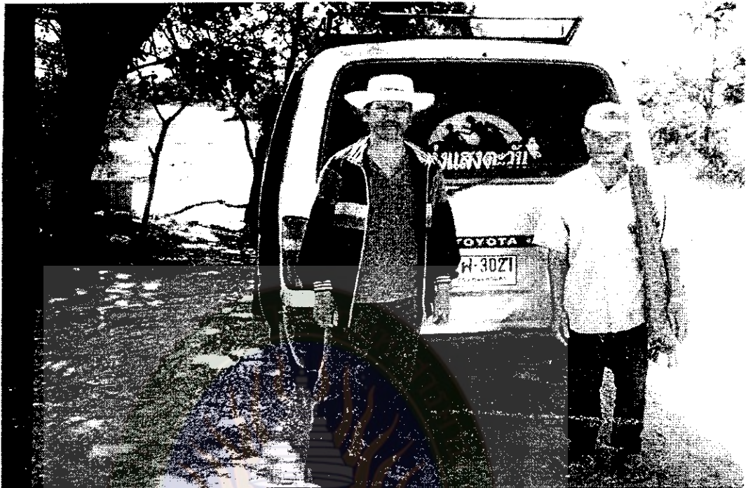
ภาพที่ 15 รายการสารคดีทุ่งแสงตะวัน ศึกษาข้อมูลป่าและการอนุรักษ์ป่าดงลำพัน เมื่อ พ.ศ.2541