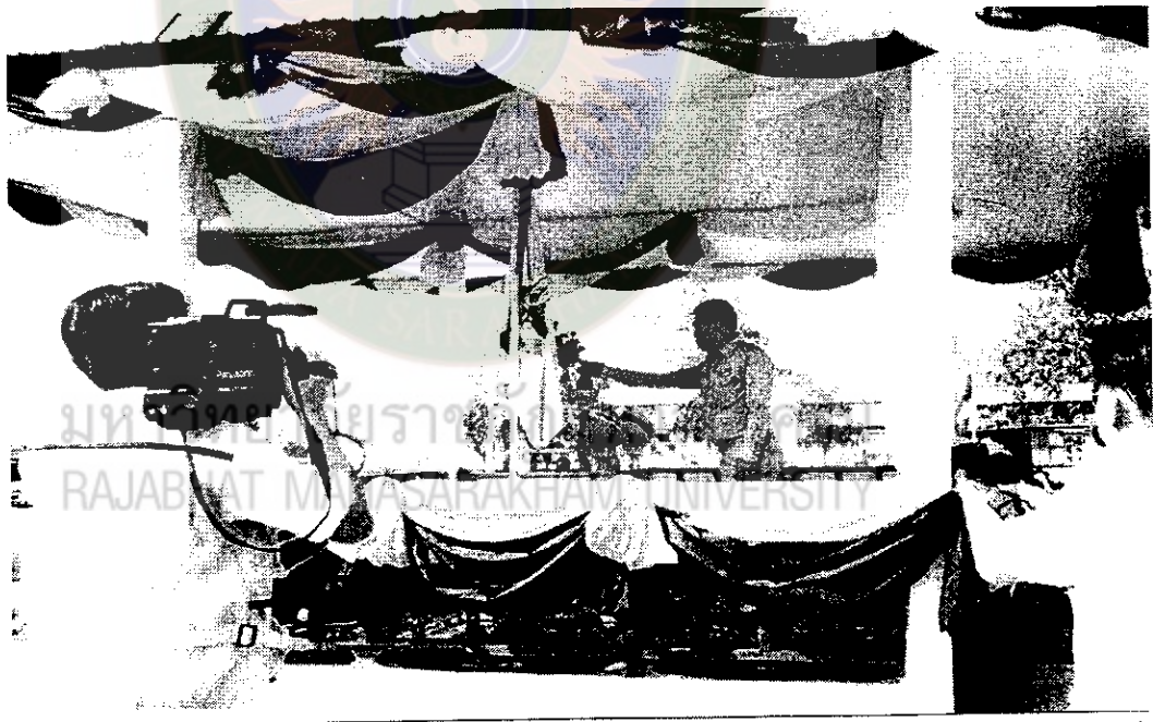
ภาพที่ 18 คณะข้าราชการ นักเรียน นักศึกษา พ่อค้าและประชาชนทั่วไปจัดพิธีต้อนรับ

ธงพิทักษ์ป่ารักษาชีวิต ณ พระตำหนักภูพานราชนิเวศ 23 พย. 2540