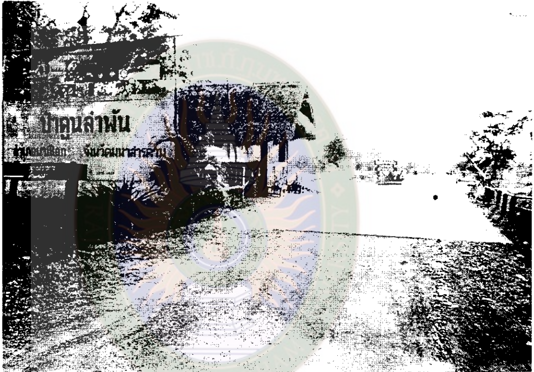
ภาพที่ 3 ด้านหน้าของบริเวณเขตห้ามล่าสัตว์ป่าคุณลำพัน ก.ค. 2545