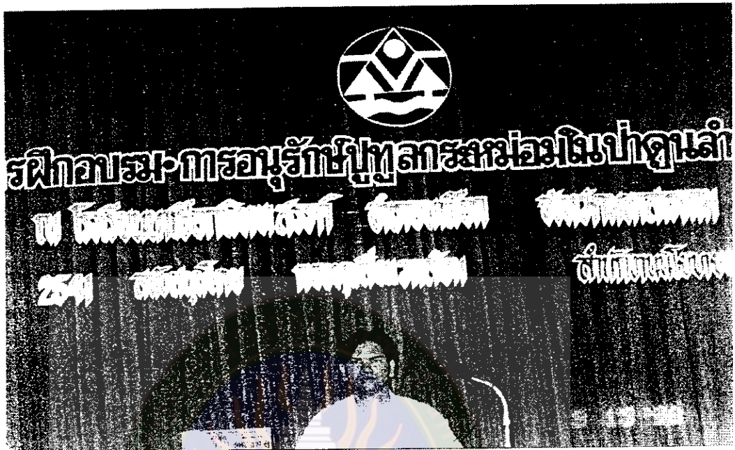
ภาพที่ 12 ประธานชมรมอนุรักษ์ดินและป่าทุ่งลาเวนเดอร์ บรรยายการอนุรักษ์ป่าทุ่งลาเวนเดอร์ ในโครงการอบรมสิ่งแวดล้อมแก่นักเรียนโรงเรียนนาเชือกพิทยาสรรค์ 15 มี.ค. 2541