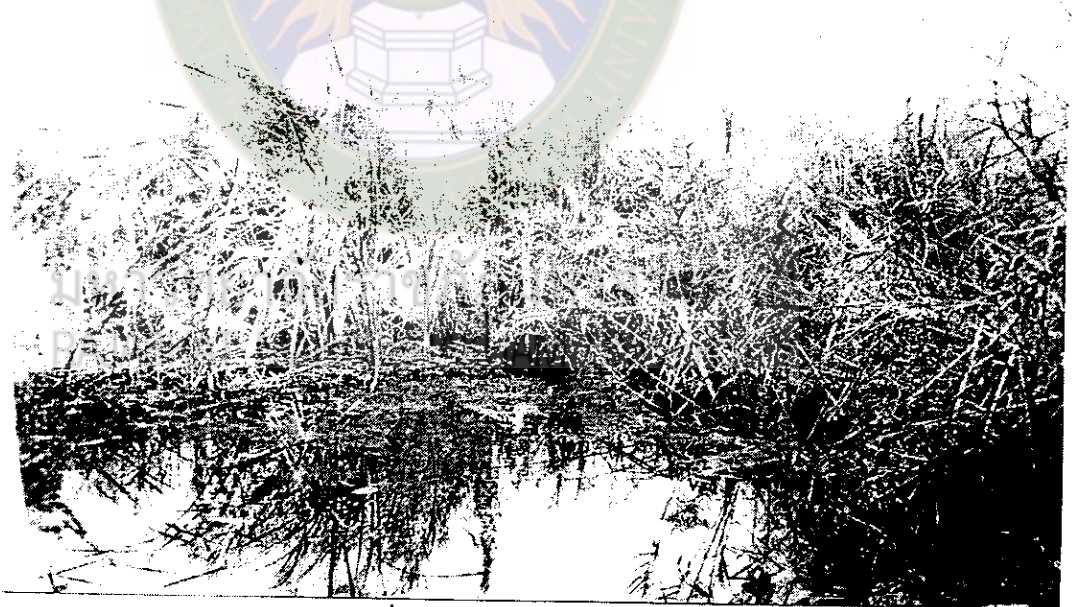
ภาพที่ 9 ต้นธูปฤๅษีหรือหญ้าลำพัน