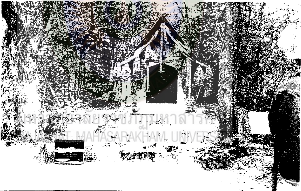
ภาพที่ 7 ศาลเจ้าปู่หลวงอุดมระยะหลัง ก.ค. 2545