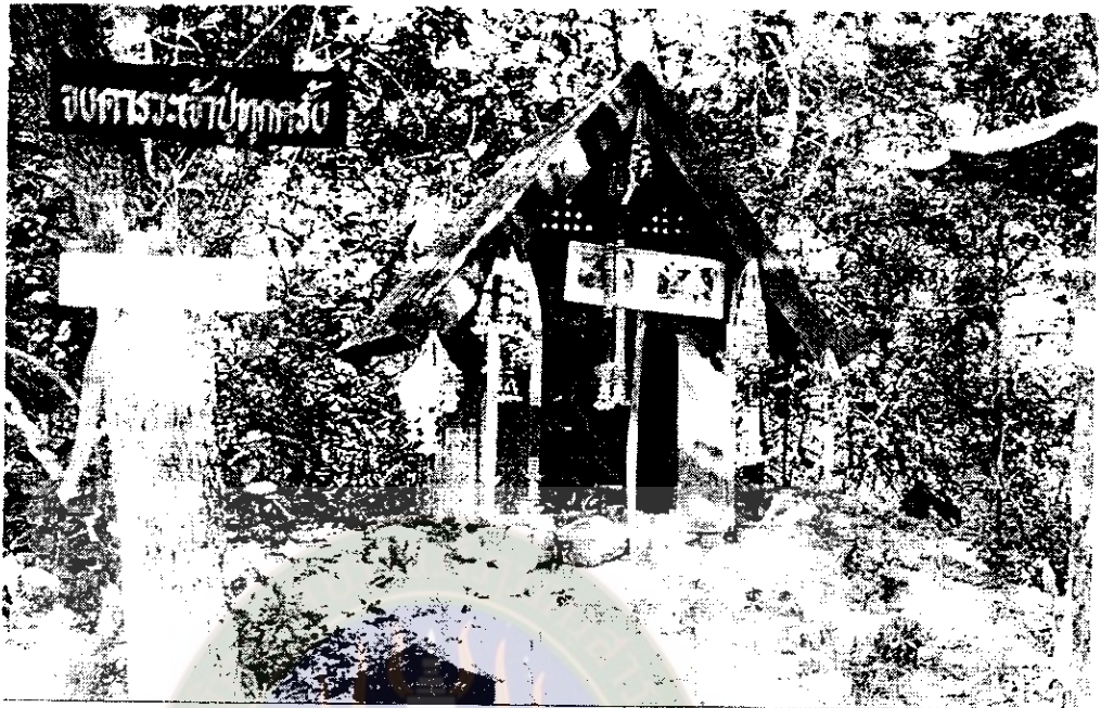
ภาพที่ 6 ศาลเจ้าปู่หลวงอุดมระยะแรก พ.ศ.2541