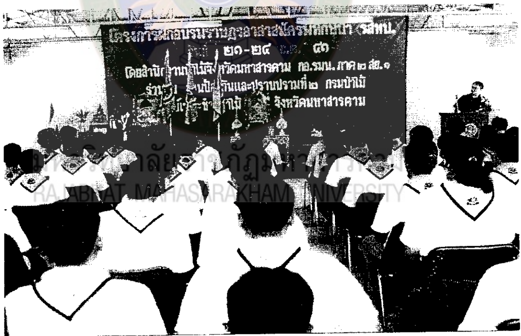
ภาพที่ 13 โครงการอบรมราษฎรอาสาสมัครพิทักษ์ป่าแก่นักเรียนอำเภอนาเชือก 21 ก.ค. 2541