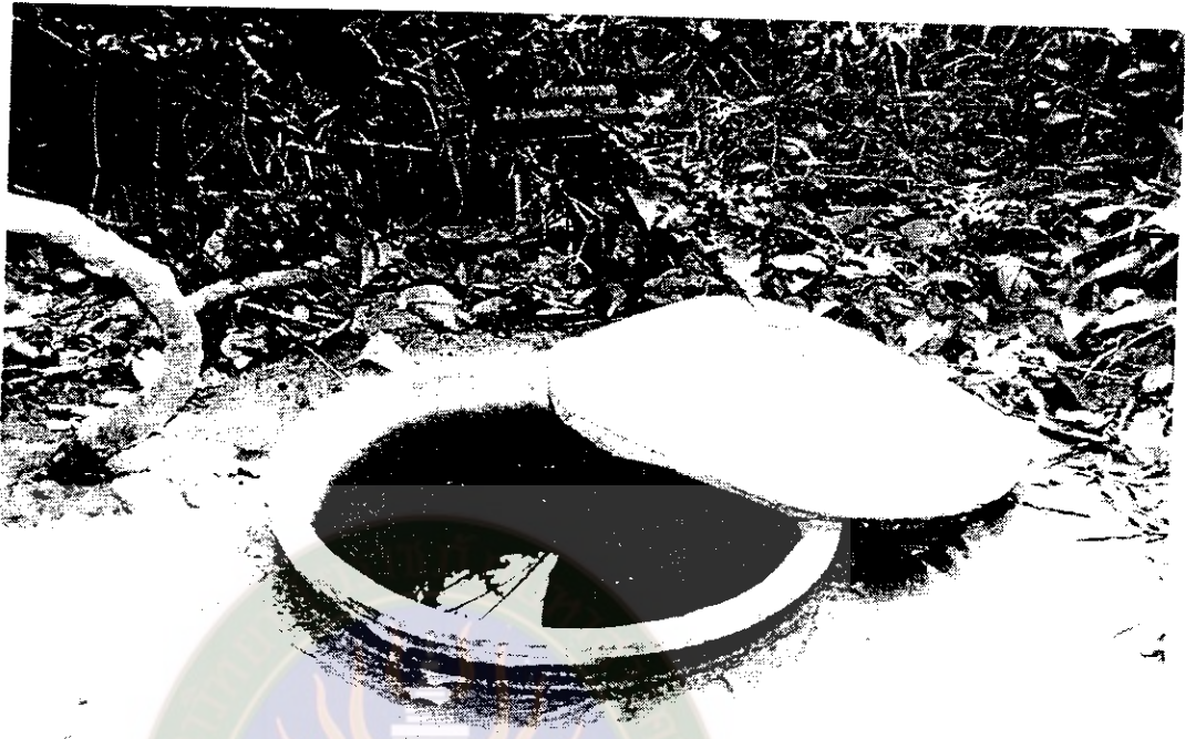
ภาพที่ 8 บ่อน้ำศักดิ์สิทธิ์