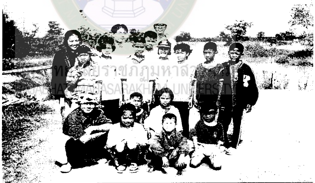
ภาพที่ 16 รายการสารคดีทุ่งแสงตะวัน ศึกษาข้อมูลป่าและการอนุรักษ์ป่าดงลำพัน