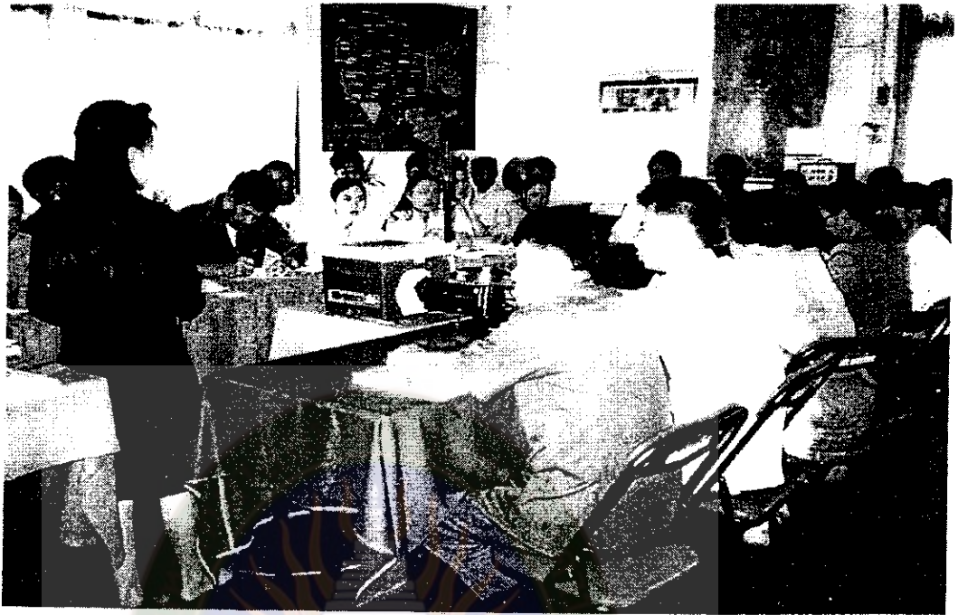
ภาพที่ 10 กิจกรรมขยายเครือข่ายแนวคิดการอนุรักษ์ป่า โดยจัดโครงการอบรมมัคคุเทศก์อาสาให้แก่ประชาชนอำเภอนาเชือก เมื่อ 27 ส.ค. 2540