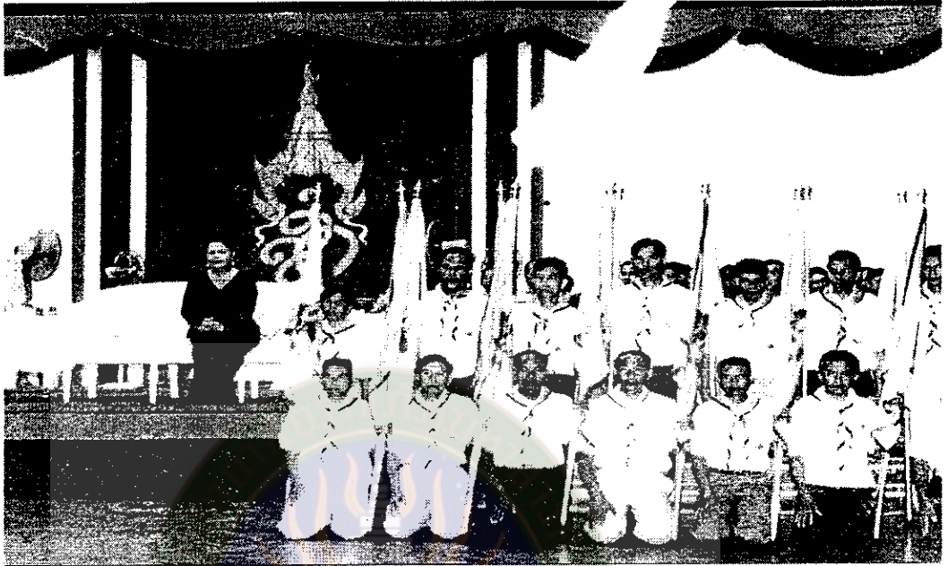
ภาพที่ 17 รับพระราชทาน

ธงพิทักษ์ป่ารักษาชีวิต ณ พระตำหนักภูพานราชนิเวศ 23 พย. 2540