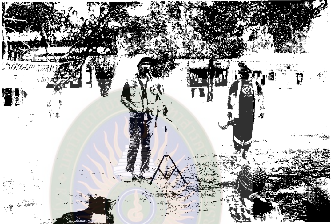
ภาพที่ 14 บรรยายการอนุรักษ์สิ่งแวดล้อมป่าดงดิบพื้นที่แก่งยาวชนจากศูนย์บริการ การศึกษานอกโรงเรียนอำเภอนาเชือก เมื่อ พ.ศ. 2540

มหาวิทยาลัยราชภัฏมหาสารคาม RAJABHAT MAHASARAKHAM UNIVERSITY