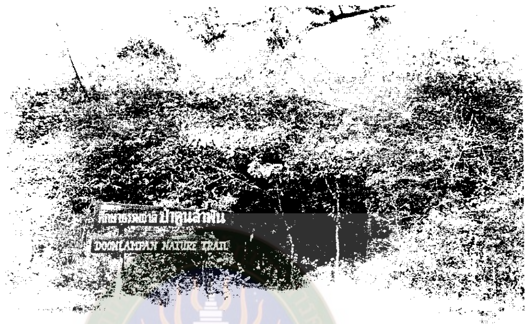
ภาพที่ 4 เส้นทางศึกษารวมชาติภายในป่าดงลำพัน