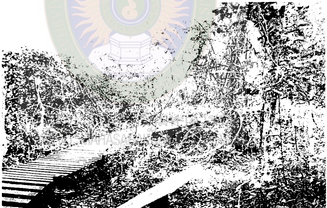
ภาพที่ 5 เส้นทางศึกษารวมชาติภายในป่าดงลำพันบางส่วนที่ทำเป็นทางยกระดับเพื่อให้มีพื้นที่ได้ทางเดินสำหรับเป็นที่อยู่ของปูและพืชสามารถเจริญเติบโตได้