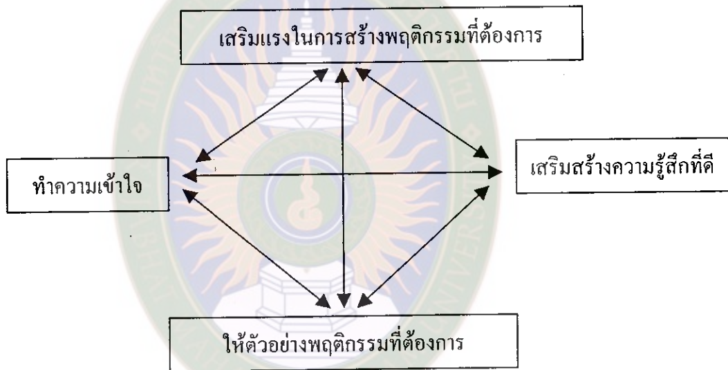
แผนภูมิที่ 1 แสดงรูปแบบของพฤติกรรมการเรียนที่เหมาะสม มหาวิทยาลัยราชภัฏมหาสารคาม RAJABHAT MAHASARAKHAM UNIVERSITY

นอกจากนี้ยังได้เสนอรูปแบบของพฤติกรรมการเรียนที่เหมาะสมดังต่อไปนี้