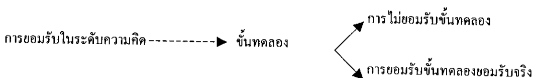
แผนภูมิที่ 1 กระบวนการยอมรับ

เบลล์ และโบเลนด์ (Beal and Bohlen. 1957 ; อ้างถึงใน จิระวัฒน์ วงศ์สวัสดิวัฒน์, 2529 : 19) ได้พูดถึงกระบวนการยอมรับว่า เป็นขั้นทดลองในระดับความคิด (Mental Trial) นั่นคือ วิทยาการแผนใหม่ได้ถูกนำมาประเมินเข้ากับสถานการณ์ในลักษณะของนามธรรม ซึ่งผลของการประเมินอาจทำให้เกิดการยอมรับหรือไม่ยอมรับในระดับความคิด การยอมรับในขั้นนี้จะมีอิทธิพลโดยตรงต่อการยอมรับในภาคปฏิบัติ และการใช้ต่อเนื่องในเวลาต่อมา หรืออาจหยุดอยู่เพียงเท่านั้นก็เป็นได้ บ่อยครั้งที่พบว่าวิทยาการแผนใหม่หลายอย่างเป็นที่ยอมรับใน